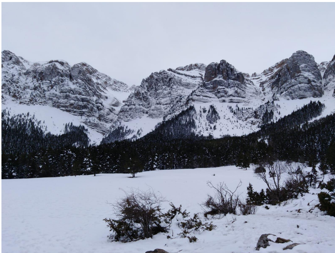
Panoràmica del Vessant Nord del Cadí, amb la Canal del Cristall i la Roca de l'Ordiguer, del 24 de març. Veiem un mantell continu amb la neu recent de la darrera nevada.