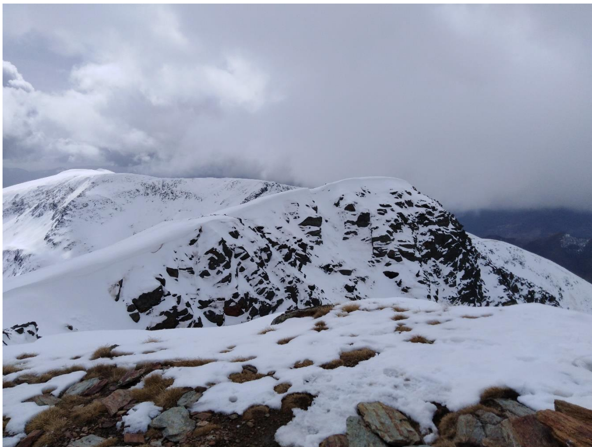
Mantell humit a la Coma del Forn, a Tavascan (Franja Nord de la Pallaresa), el dia 25. L'abundant nuvolositat i algun plugim va humitejar el mantell a totes les cotes.