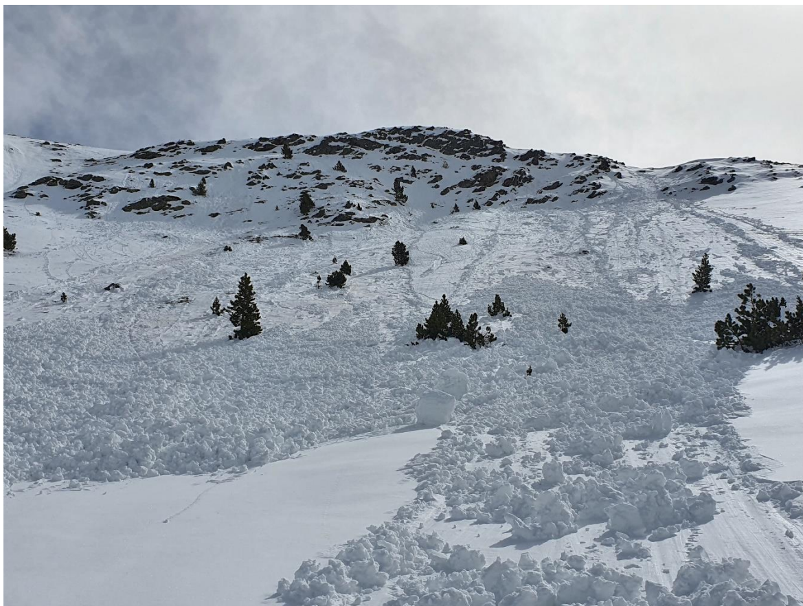
Allaus de neu humida desencadenats després del plugims i de les clarianes del dia 25. Es tracta de diverses sortides naturals puntuals, de mida 1 (petita), al Freser.