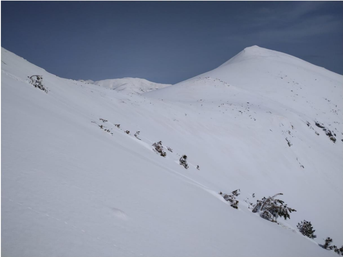
Mantell uniforme amb la neu recent de la darrera nevada, prop del Costabona (Ter-Freser), del dia 25.