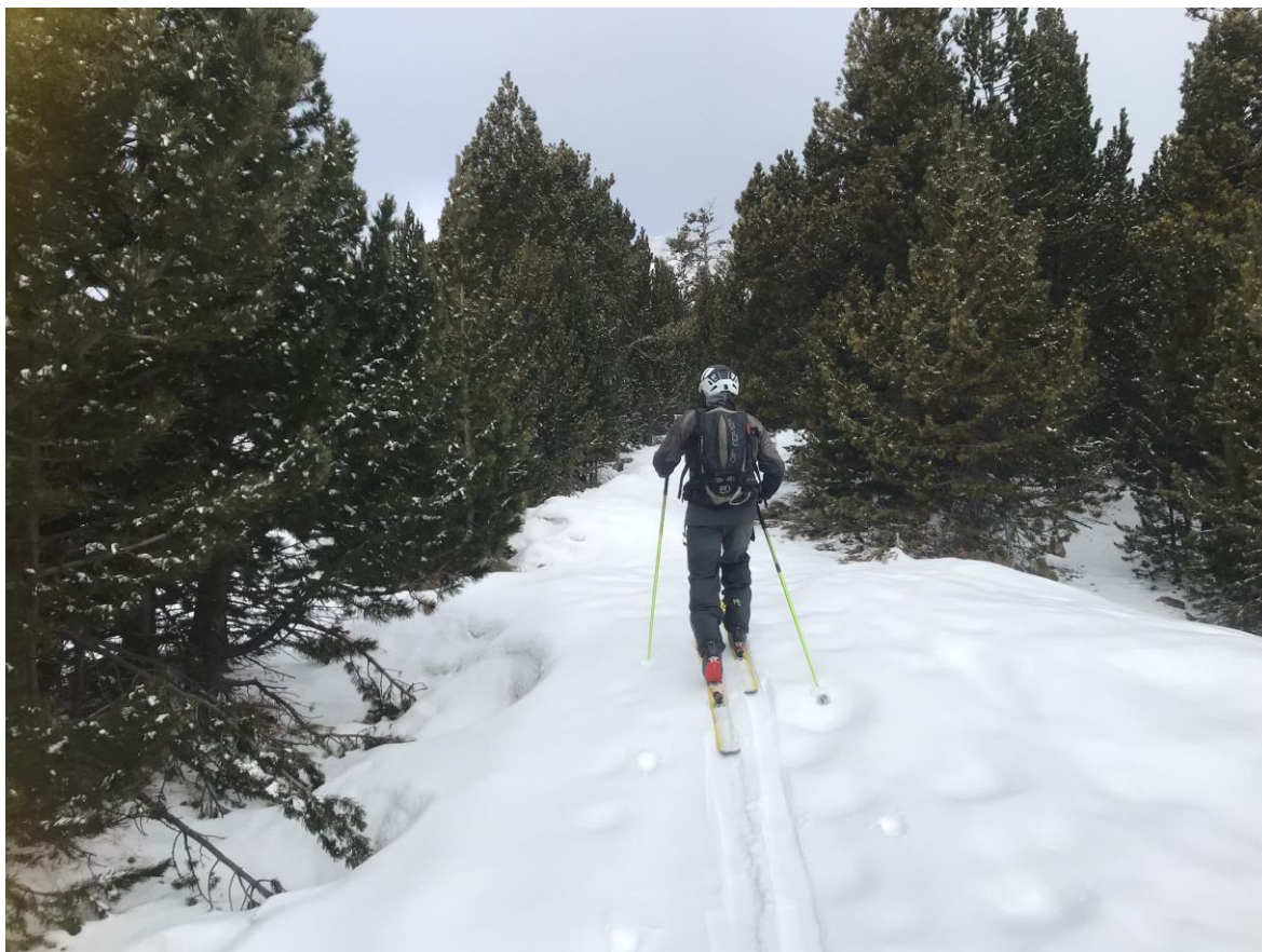
Esquiador de muntanya progressant pel bosc, direcció al coll de la Barra (Perafita-Puigpedrós), el 7 de març. El mantell conté un parell de cm de neu recent humida, dipositats damunt de crostes.