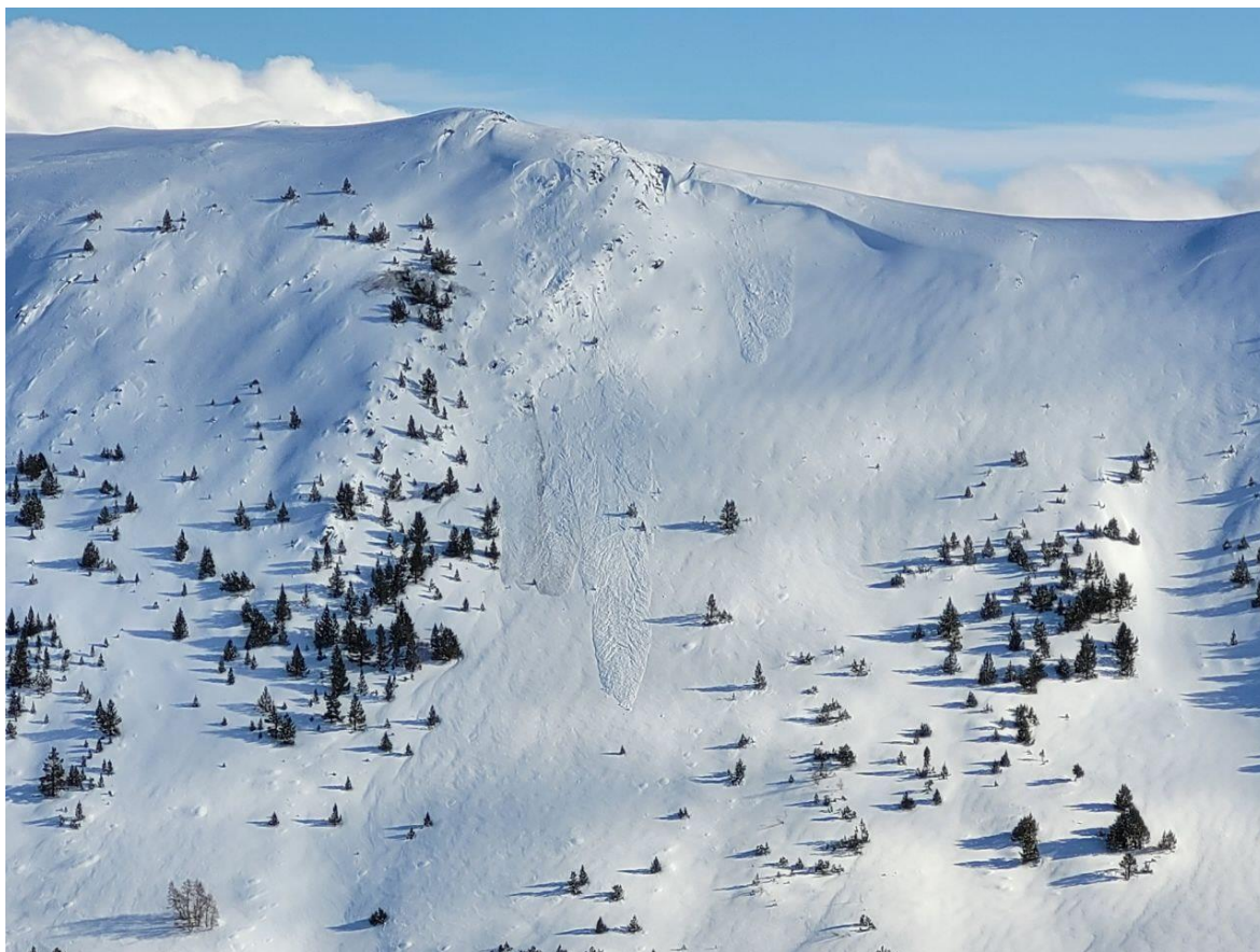
Allaus naturals de sortida lineal i puntual de mida 1 (petita) i 2 (mitjana) a Espot (Creu d'Eixol-Picardes), de diumenge, 13 de març.