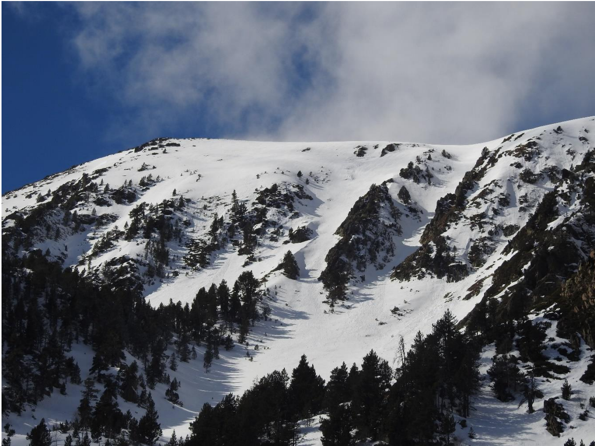
Les Pletes de Gavàs, des del Mirador del Corbiu, a Tavascan, el 3 de març. Es veu un mantell continu i s'intueix una purga relacionada amb la nevada del dia anterior (5 a 10 cm de neu recent).