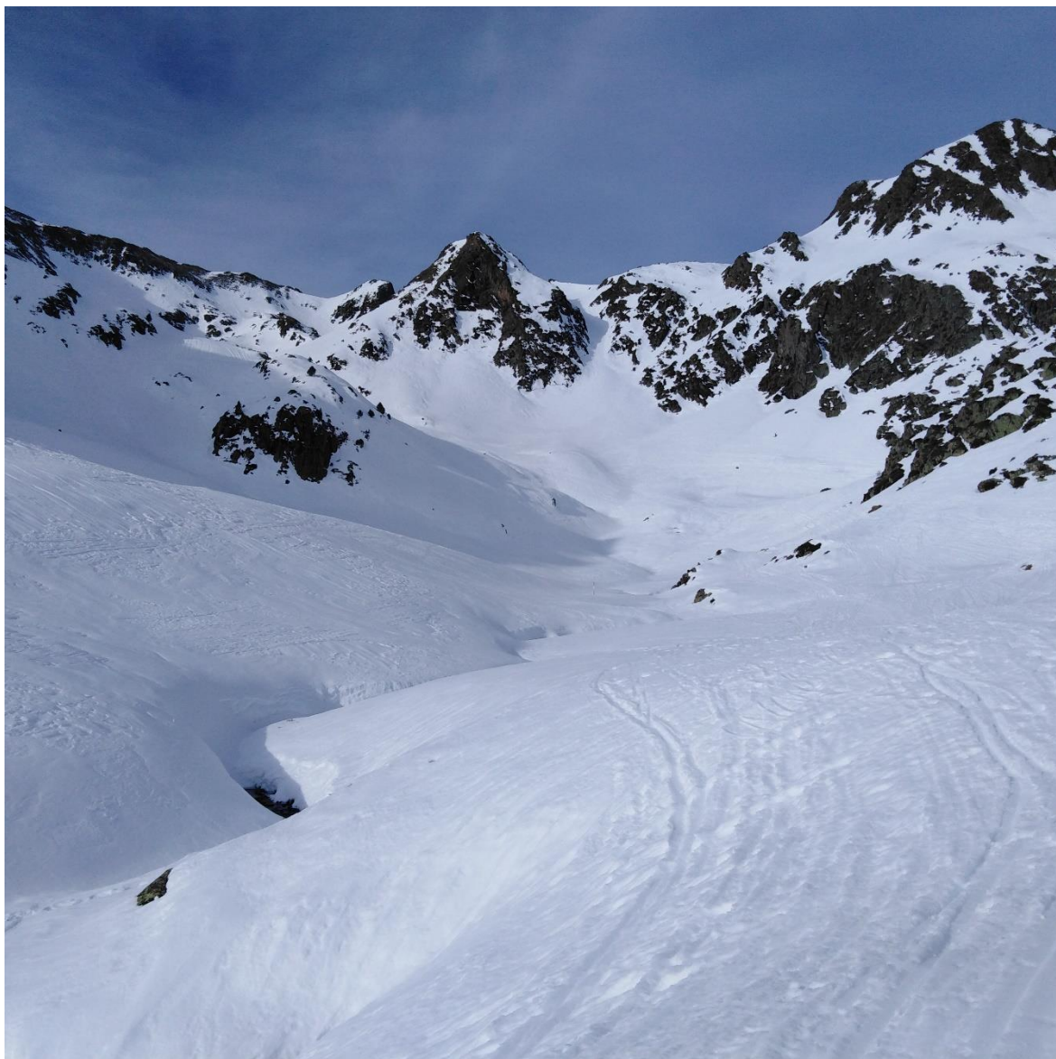
Vall de Margalida, a Tavascan (Franja Nord de la Pallaresa), el 4 de febrer. El mantell apareix endurit i consolidat, sense activitat allavosa recent.