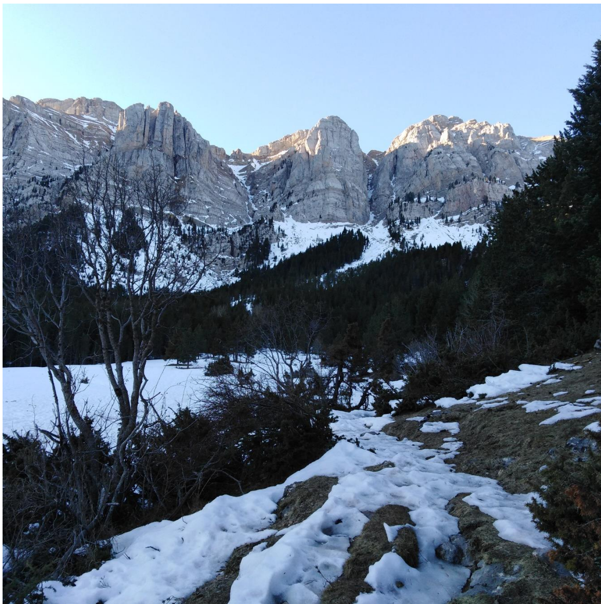
Roca de l'Ordiguer i Canal del Cristall (Vessant Nord del Cadí-Moixeró), el 9 de febrer. El mantell és escàs i està endurit. Les Canals apareixen amb molt poca neu per la manca de precipitacions.