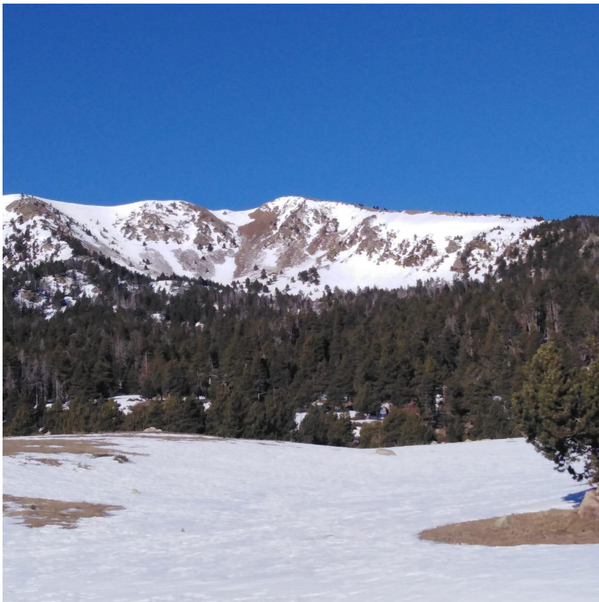
Imagen de la Vall d'Aràns (Perafita-Puigpedrós), el martes 18 de enero. La distribución del manto nivoso por encima del nivel de bosque es muy irregular debido al viento que, predominantemente del norte y oeste, ha ido soplando a lo largo de la temporada. En este sector, en zonas protegidas, los grosores de nieve siguen siendo superiores a los habituales para la época del año, debido sobre todo a las nevadas de principios de diciembre.