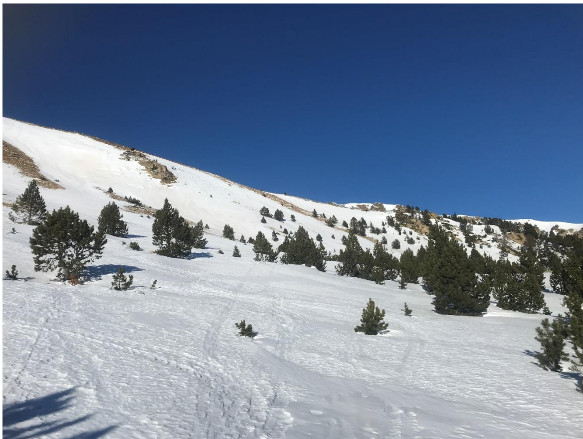
Mantell endurit i encrostat al límit del bosc, en direcció al coll de la Barra (Perafita-Puigpedrós), el dia 6 de gener.