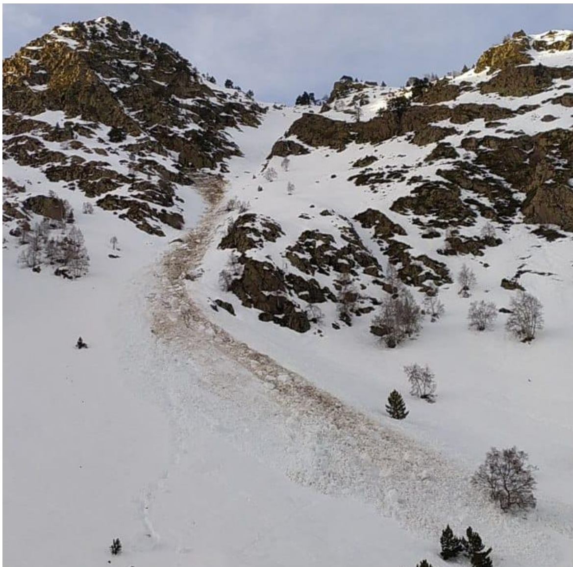
Lliscament basal a Tavascan (Franja Nord de la Pallaresa), del 3 de gener. L'allau arrenca des de la canal, just per sota de l'esperó rocós, en terreny llis i inclinat. El lliscament frega la mida 2 (mitjana).