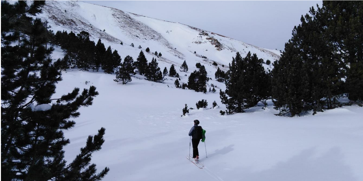
Panoràmica del Coll de la Barra (Perafita-Puigpedrós), des del límit del bosc, l'1 de desembre. S'observen deflacions a lloms i carenes a causa del fort vent de dies enrere.