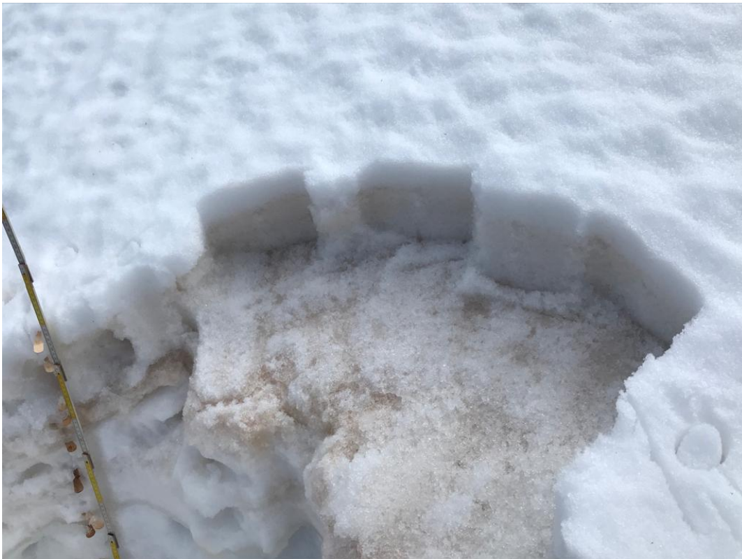
Ha estat característica comuna d'aquest episodi que totes les allaus de fusió han lliscat per sobre de les crostes marrons.