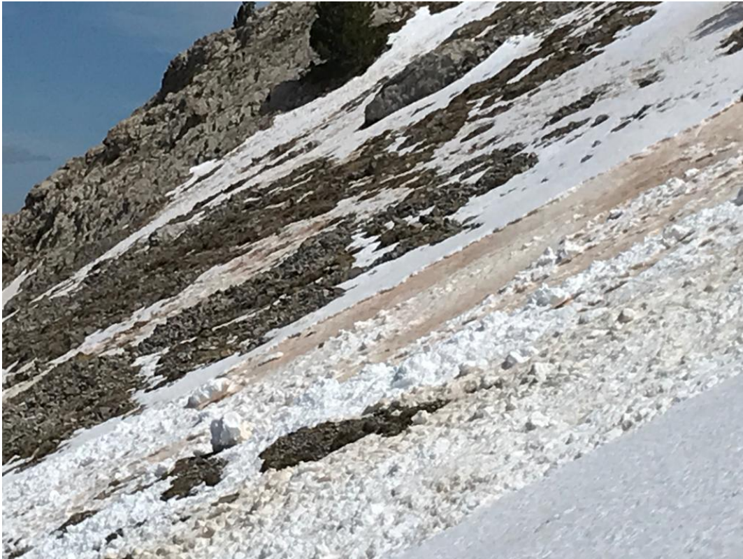
Allau de neu humida de mida D1.5 caiguda al Cadí a principis de setmana.