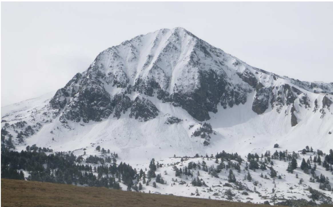
Allaus de mida D2 observades el dilluns 3 de maig al sector de Beret (Aran).

Evolució del gruix de neu al terra a Bonaigua durant la setmana del 3 al 7 de maig. El gruix passa de 62 cm a 0 cm el diumenge a la tarda.