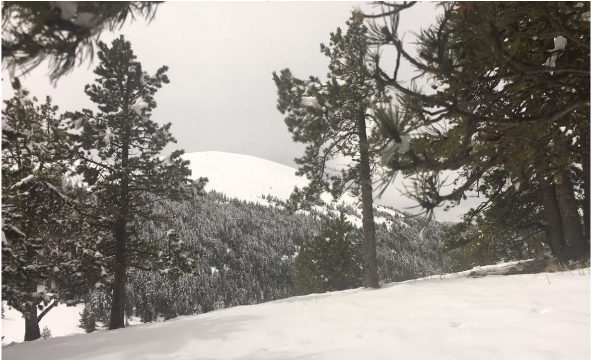
Paisaje de Tuixén (Prepirineu) del día 2 de mayo, tras la nevada del sábado, con espesores de nieve reciente de 20 cm.