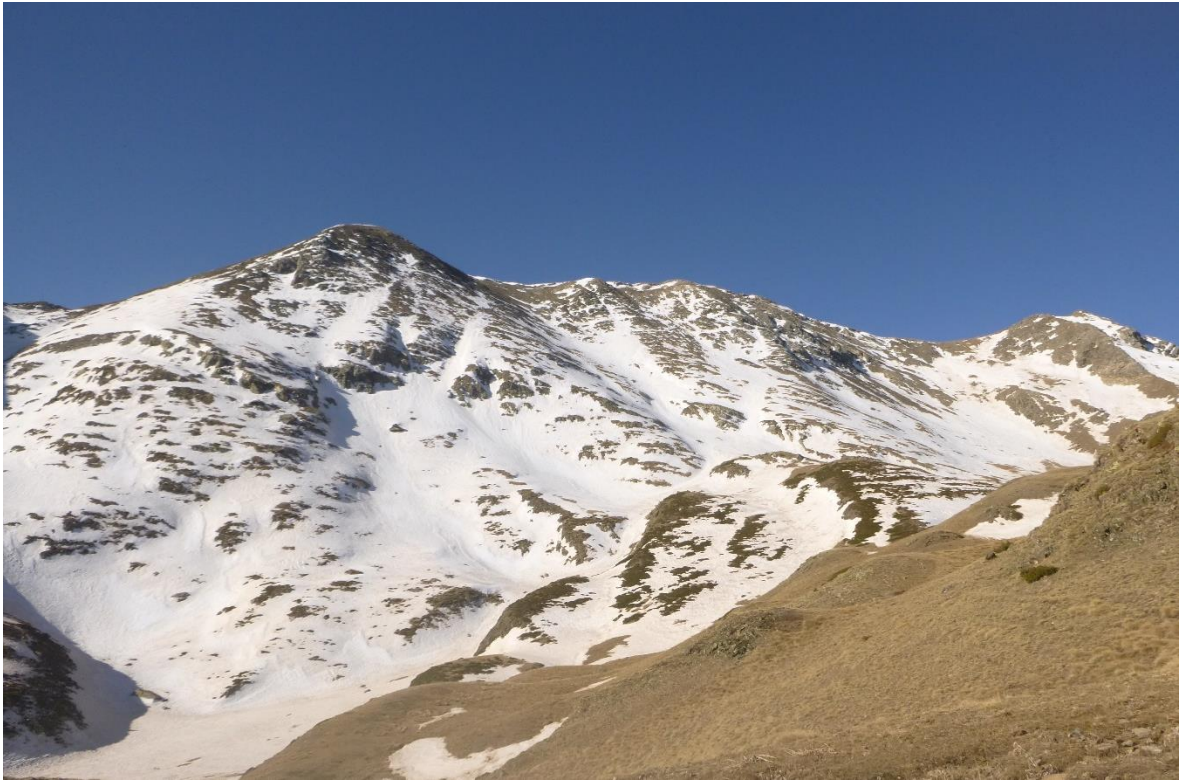
Panoràmica des de Filià (Ribagorçana-Vall Fosca), del 7 d'abril, amb un mantell endurit i encrostat a les obagues. A les solanes ja ha desaparegut o només apareixen algunes clapes aïllades.