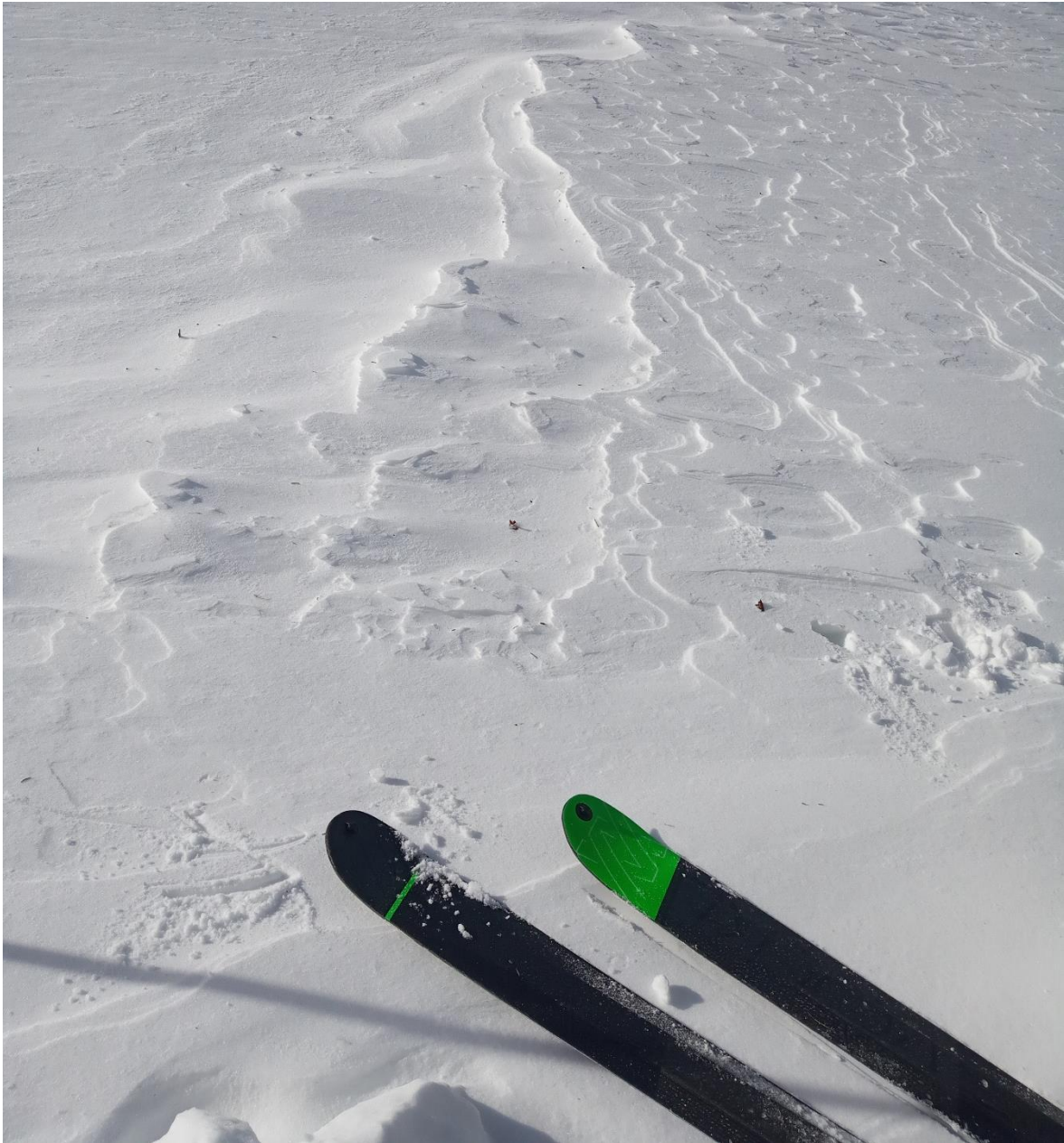
Neu ventada en forma de ripples (formes erosives de la superfície del mantell que apunten en la direcció del vent) del 21 de març al refugi de La Pleta del Prat, a Tavascan (Franja Nord de la Pallaresa), a 1.800 metres.