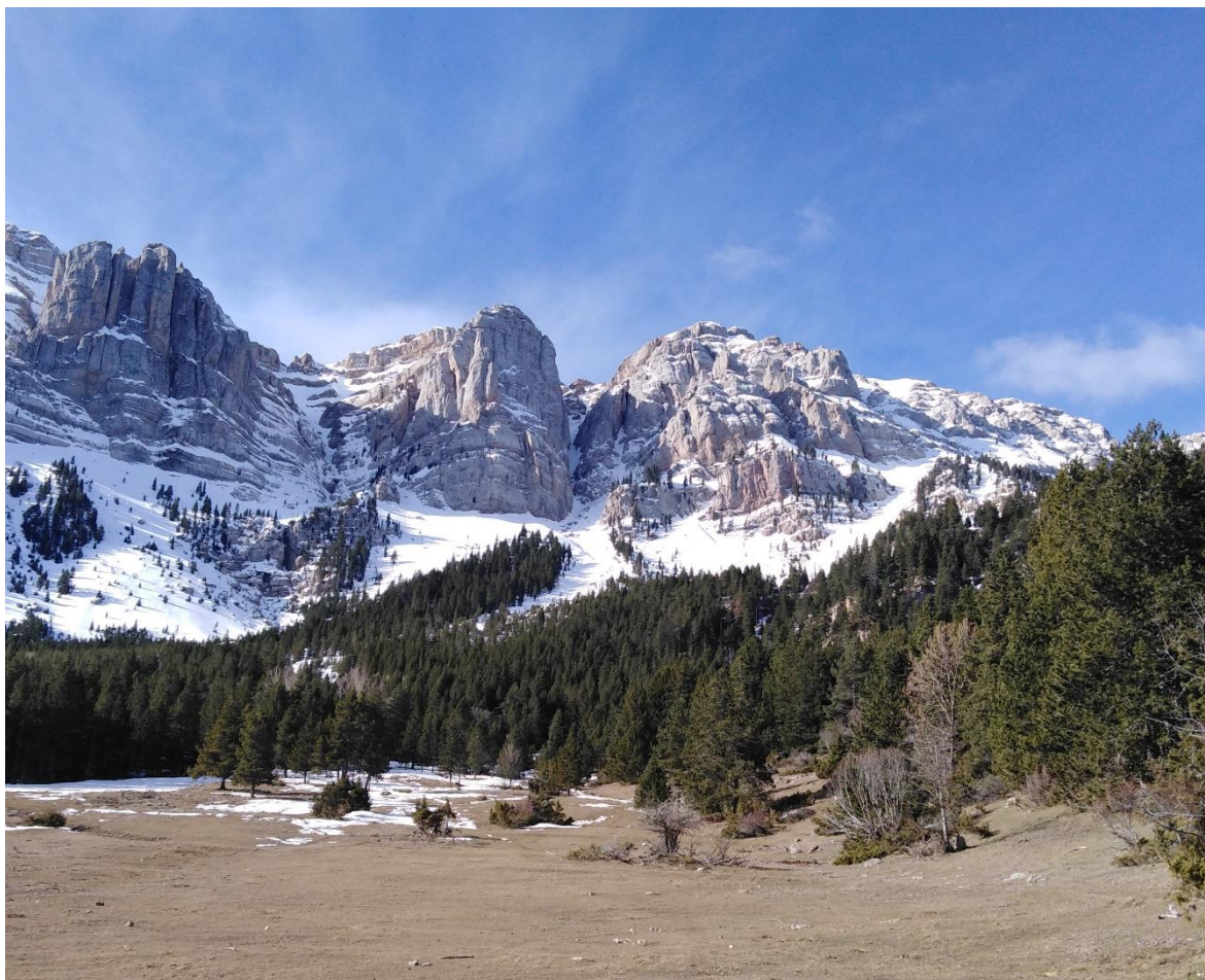
Roca i Canal de l'Ordiguer (Vessant Nord del Cadí-Moixeró), des de Prat de Cadí, el 19 de març. En cotes baixes el mantell ha desaparegut i és continu per damunt dels 2.000 metres.