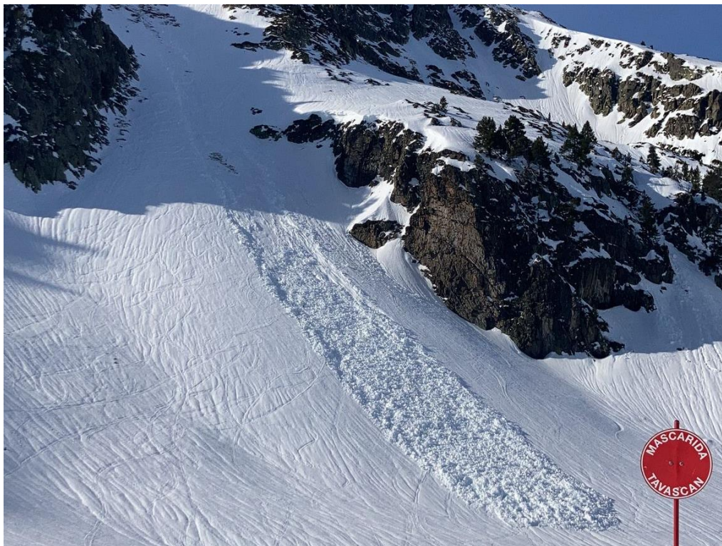
Allau de neu humida de sortida puntual, de mida 1 (petita), a Tavascan (Franja Nord de la Pallaresa), del dia 28 de gener.