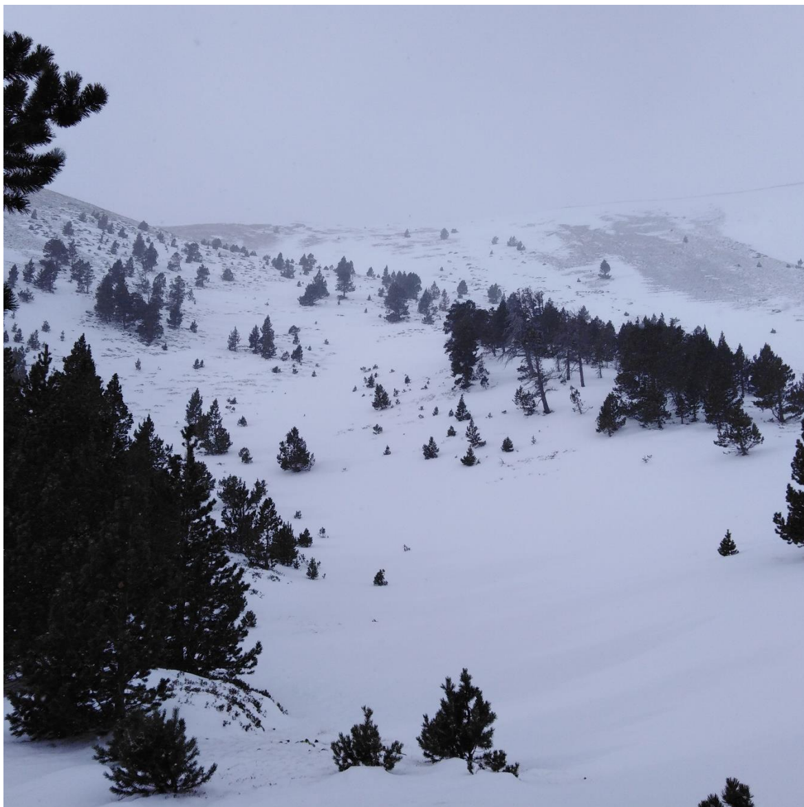
Imatge de paisatge al Coll de la Barra (Perafita-Puigpedrós) el dia 5 de gener de 2021. El mantell es presenta ventat, amb acumulacions i deflacions a les cotes més elevades, i més regular a zones protegides pel bosc.