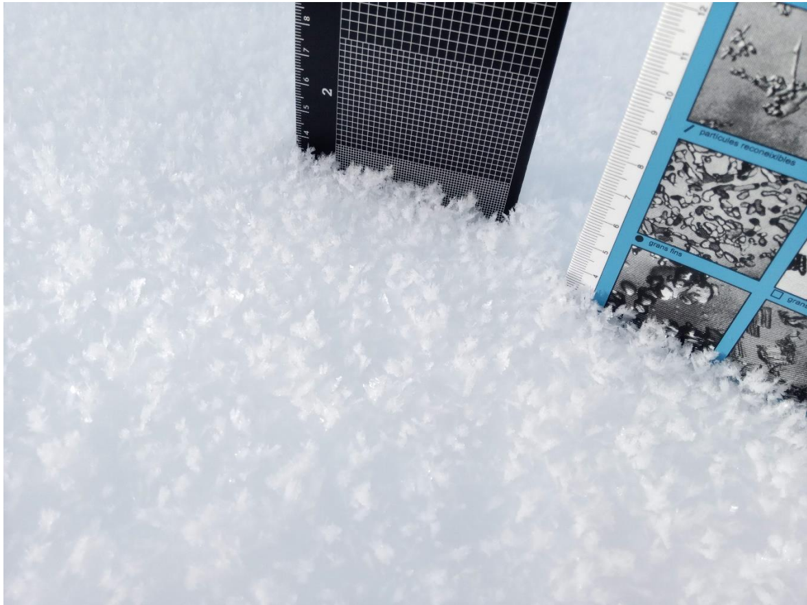
Gebre de superfície, observat el dia 1 de gener a Portainé (Pallaresa).