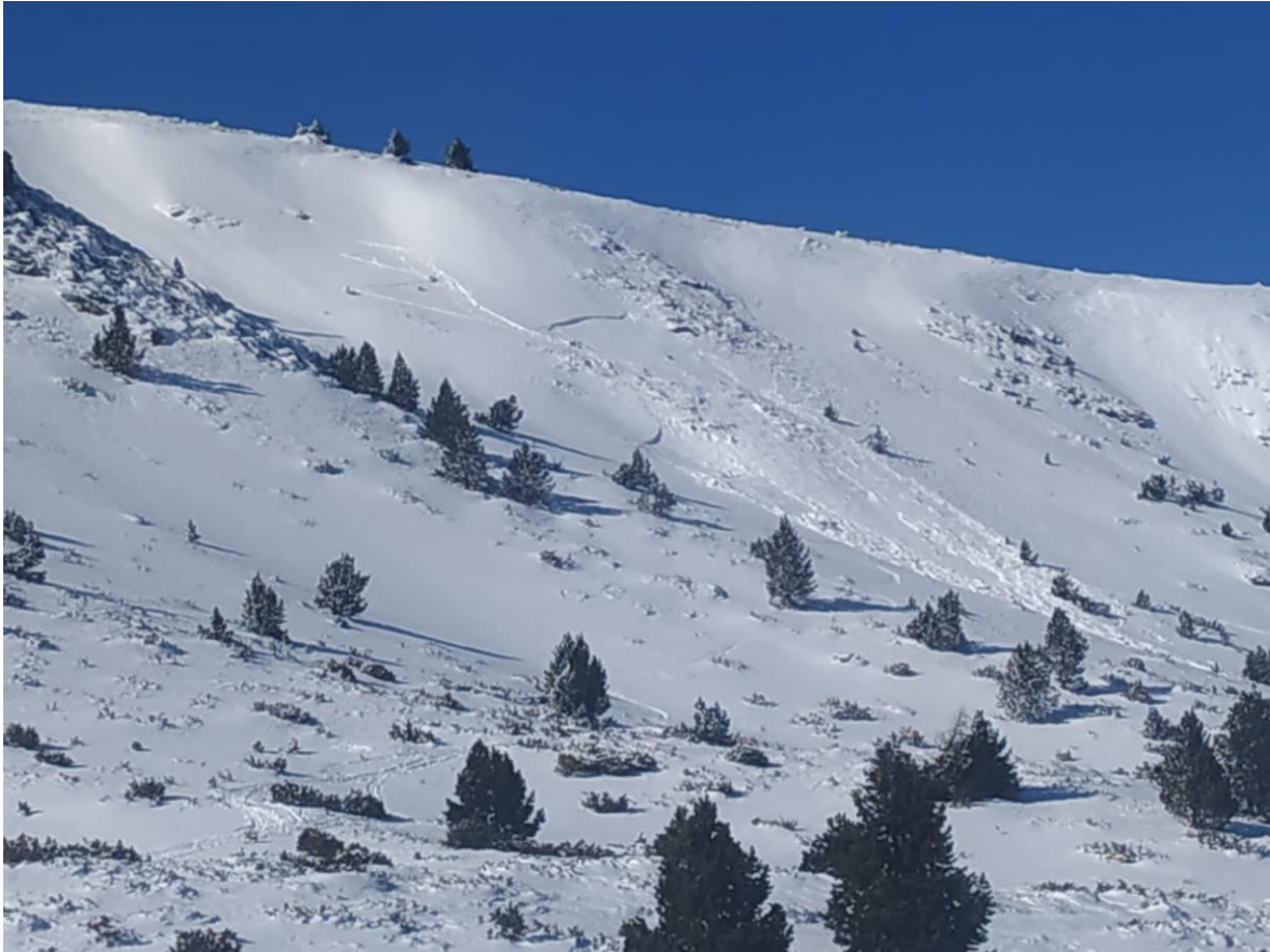
Imatge del vessant est del Pic de l'Orri amb l'allau. S'observa el relleu convex a la zona de sortida i la propagació de l'esquerra cap a l'esquerra, així com els blocs a la zona de trajecte.