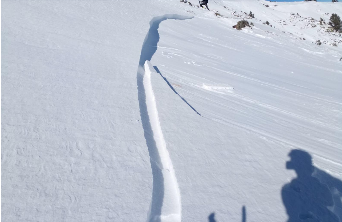
Allau de placa de neu ventada en el vessant est del Pic de l'Orri (Pallaresa) del 3 de gener. L'allau va ser desencadenada per un grup amb esquís de muntanya en ascens. Es veu clarament la cicatriu de la placa i la superfície sobre la que llisca.