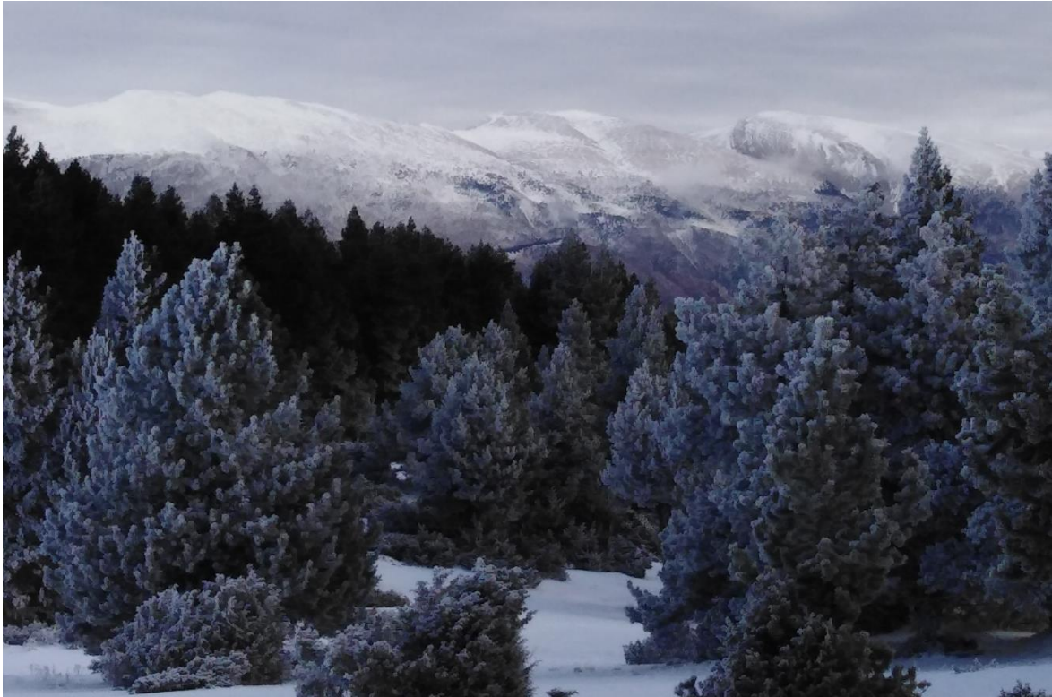
Neu recent i panoràmica del vessant sud del Cadí, des de la Tossa Pelada (Prepirineu), l'1 de gener de 2021. Als pins es pot veure el gebre opac pel pas de núvols amb vent i temperatures negatives.