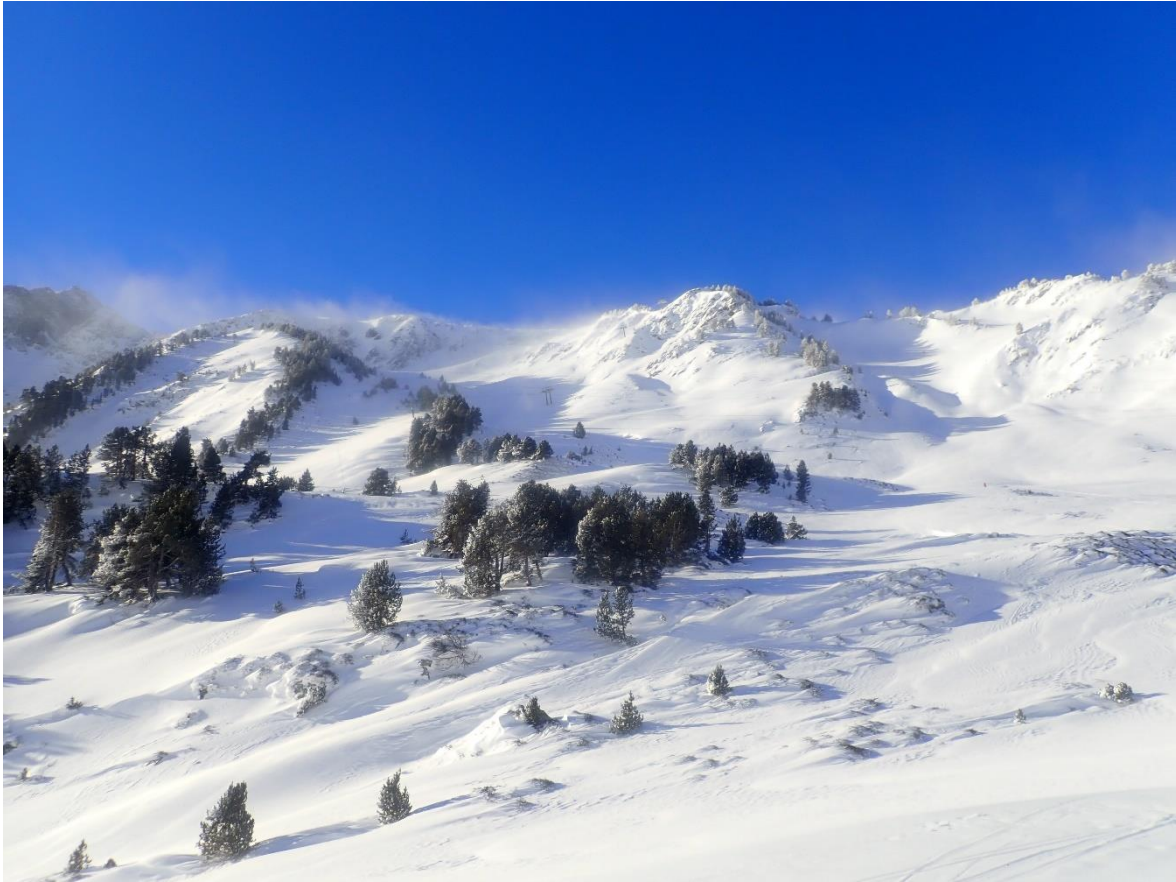
Neu ventada i fort transport a les crestes el dia de Sant Esteve a la Bonaigua (Aran-Franja Nord de la Pallaresa).