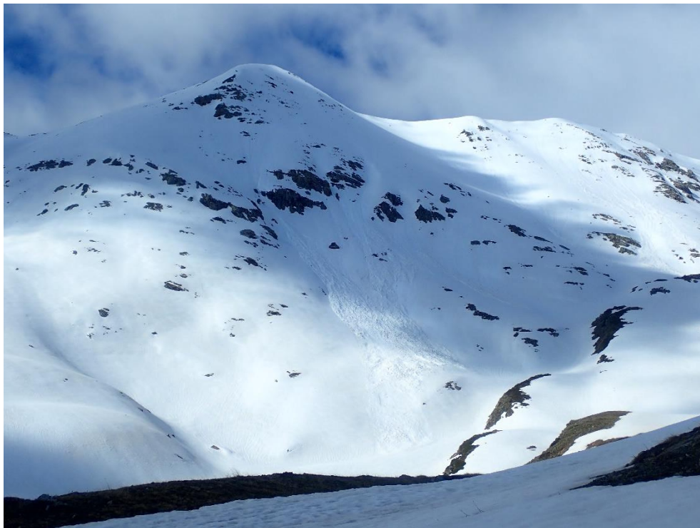
Aspecte del mantell nival a la Vall de Filià (Ribagorçana-Vall Fosca) dijous dia 30 d'abril. El mantell encara presenta certa homogeneïtat entre 2100 i 2200 m. Es poden veure algunes purgues de sortida puntual en obagues, amb sortida a punts rocósos i de fort pendent.