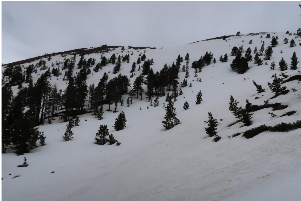
Imatge del Coll de la Barra (Perafita-Puigpedrós) el 27 d'abril de 2020. Tot i que el mantell és encara continu ja comença a aflorar el terra o alguns arbusts de manera local. A la zona de carena es poden apreciar deflacions.