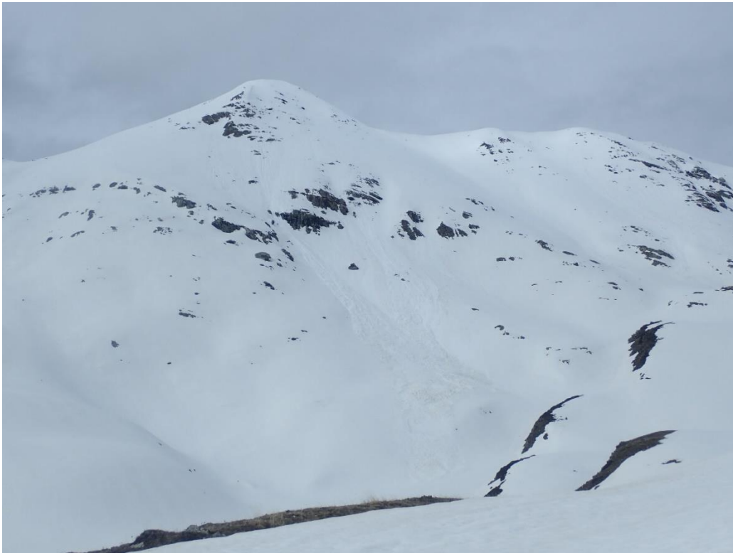
Allau natural de neu humida observada el 22 d'abril a Filià (Ribagorçana-Vall Fosca). L'activitat allavosa està relacionada amb els xàfecs de neu a cota alta i la pluja.