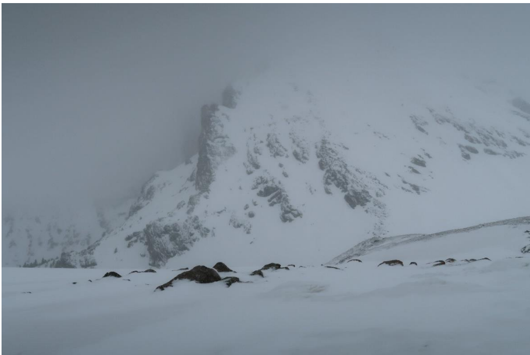
Contraforts del Gra de Fajol Gran (Ter-Freser) emblanquinat per la neu recent acabada de precipitar el dimecres 22, amb gruixos a 2500 m que van acumular fins a 15 cm. La cota de neu al terra va baixar fins als 1900 m a la Vall del Ter. Amb les primeres clarianes es van veure purgues naturals de sortida puntual als sectors amb més desnivell.