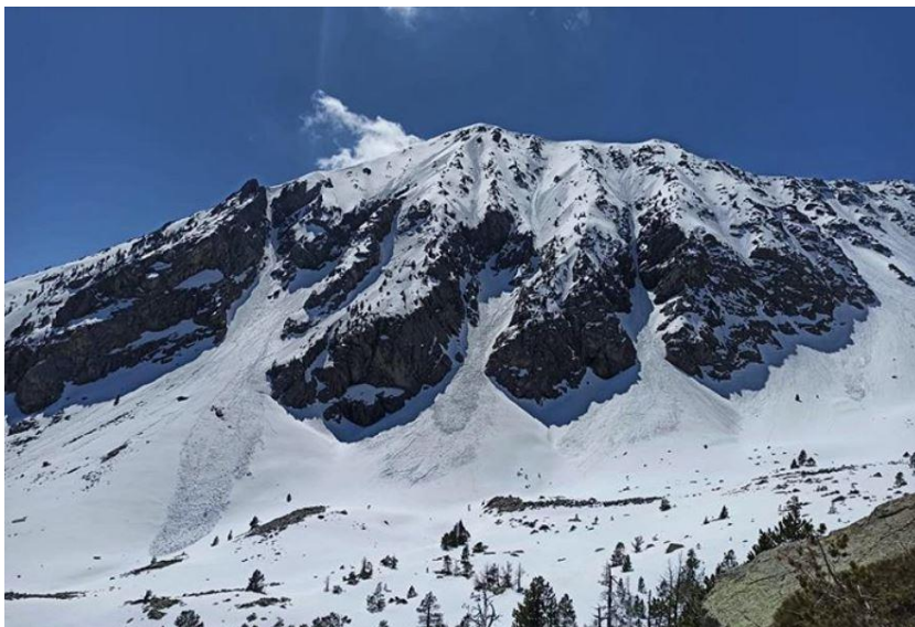
Allaus naturals de neu humida, restes observades el 17 d'abril, al Gra de Fajol (Ter-Freser). L'activitat està associada probablement a la neu recent caiguda el dilluns 13 d'abril.