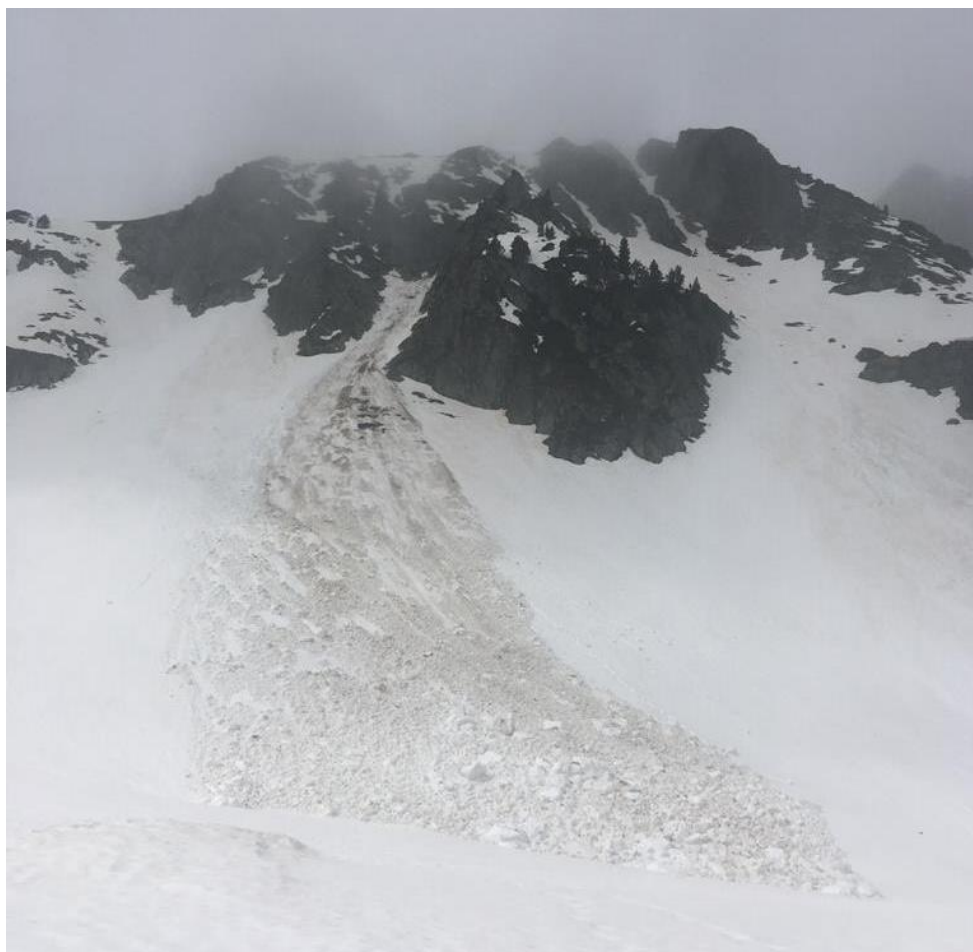
Allau de lliscament basal caiguda entre dissabte 18 i diumenge 19 a Tavascan (Franja Nord de la Pallaresa). S'observen antigues purgues superficials.