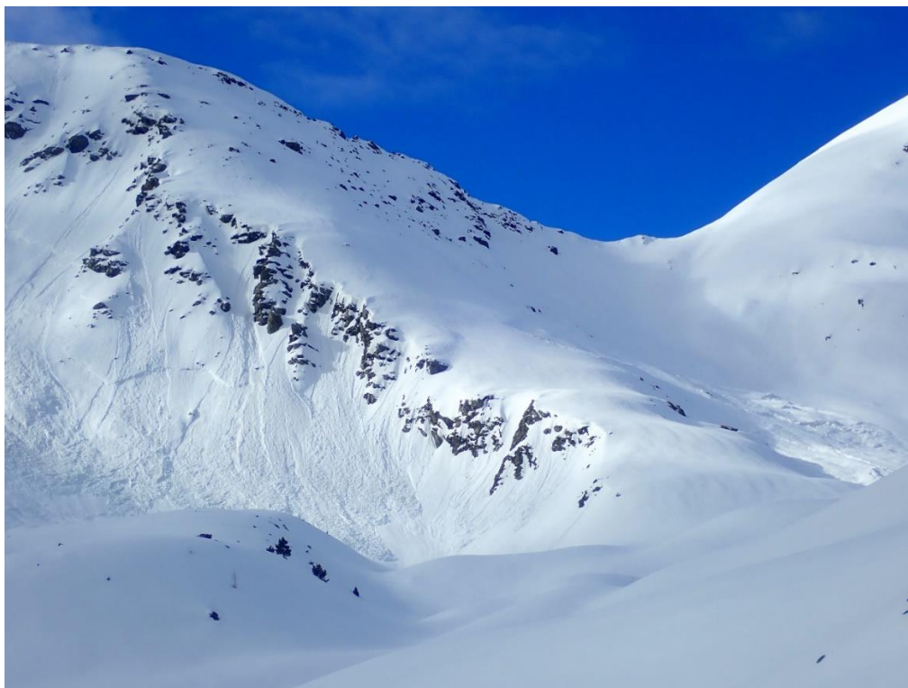
Allaus naturals de neu humida observats el matí de dimecres 8 d'abril a Filià (Ribagorçana-Vall Fosca). L'activitat està associada, amb gran probabilitat, als xàfeces del dia anterior, amb una cota de neu al voltant dels 2400-2500 m.