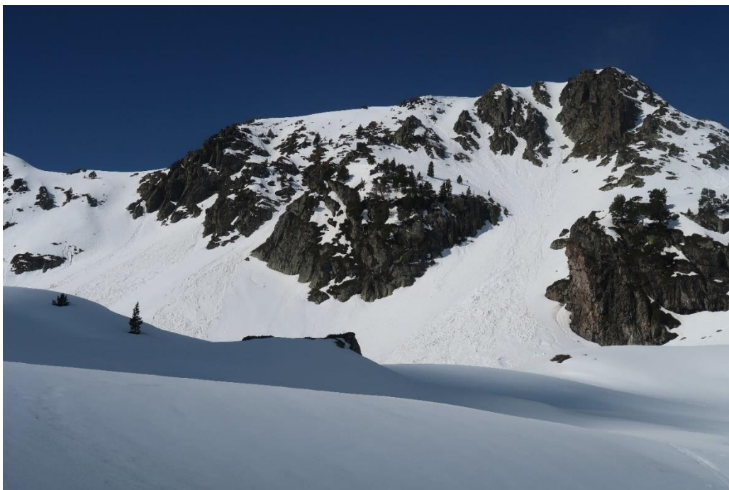
Allaus naturals de neu humida en forma de sortida puntual del divendres 10 d'abril a Tavascan (Franja Nord de la Pallaresa). S'observen purgues associades, amb gran probabilitat, als xàfeces recents i a una cota de neu elevada. En vessants orientats a sud ja van aflorant les capes de neu marró antigues.