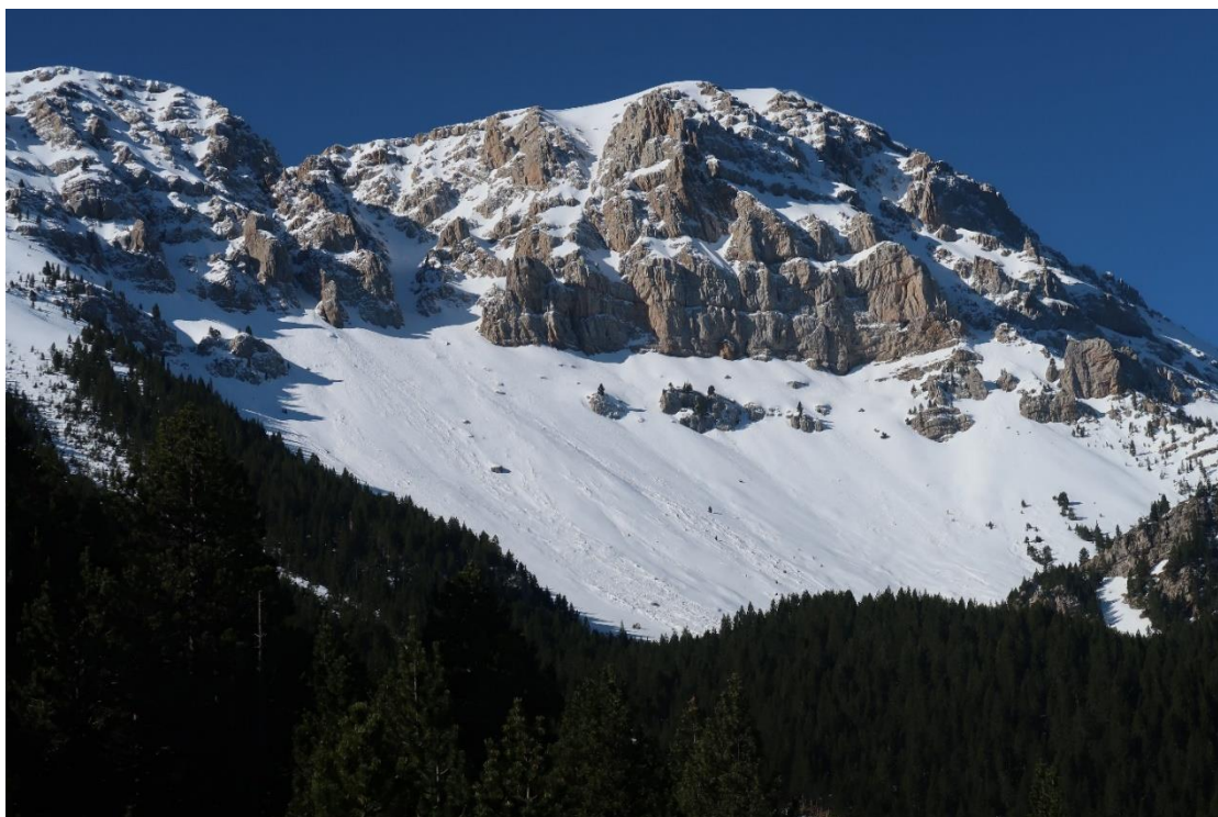
Panoràmica de la Roca de l'Ordiguer (Vessant Nord del Cadí-Moixeró), del sábado 4 de abril. Se ven las purgas de nieve húmeda caídas días atrás.