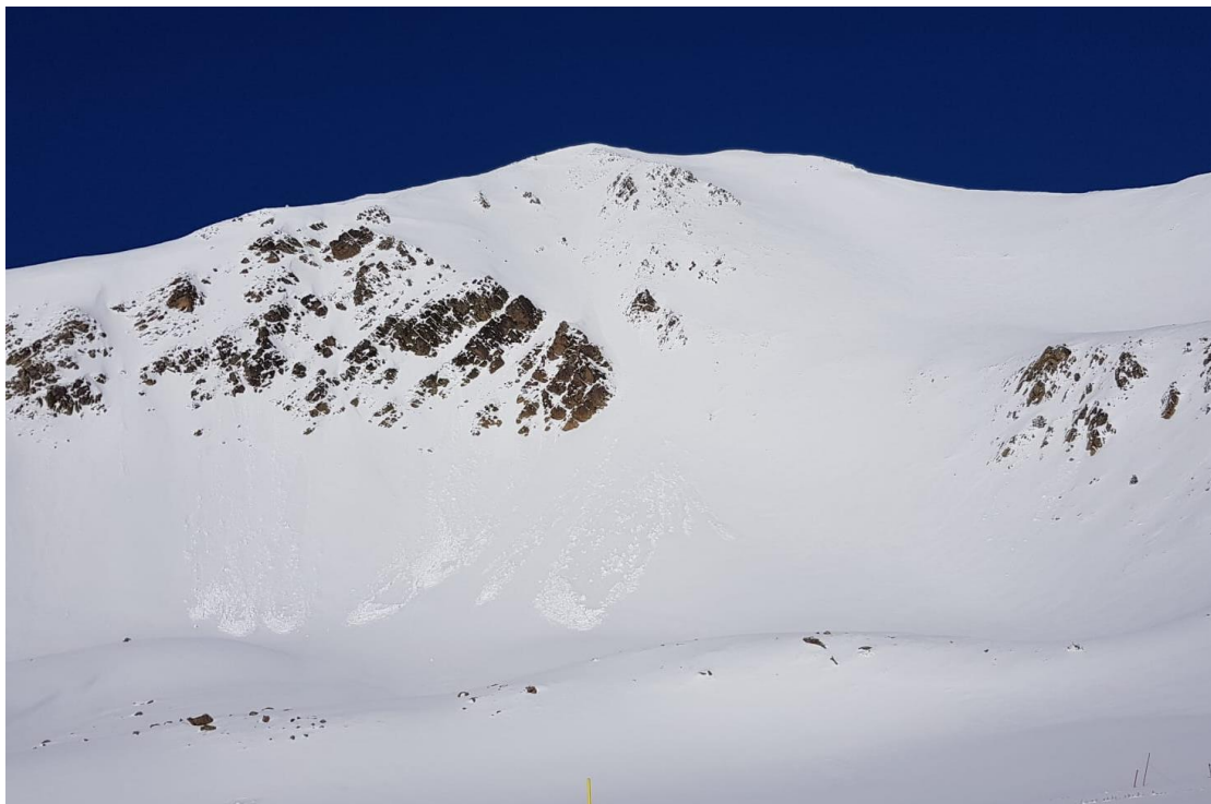
Aludes naturales de nieve húmeda en forma de salida puntual el viernes 3 de abril en las estribaciones orientales del Bastiments (Ter-Freser). Se observan purgas en la vertiente este, después de las nevadas recientes.