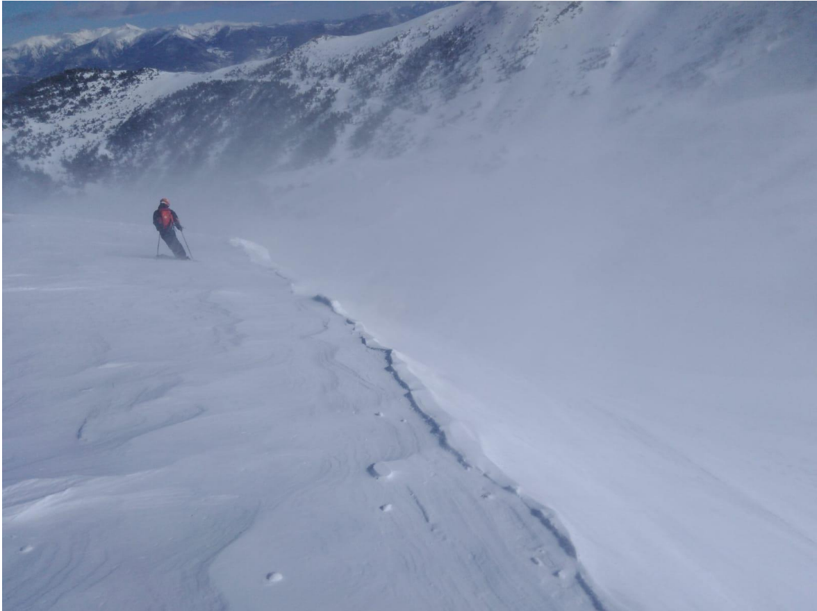
Torb per efectes del fort vent i el transport de la neu recent seca a Espot (Pallaresa).