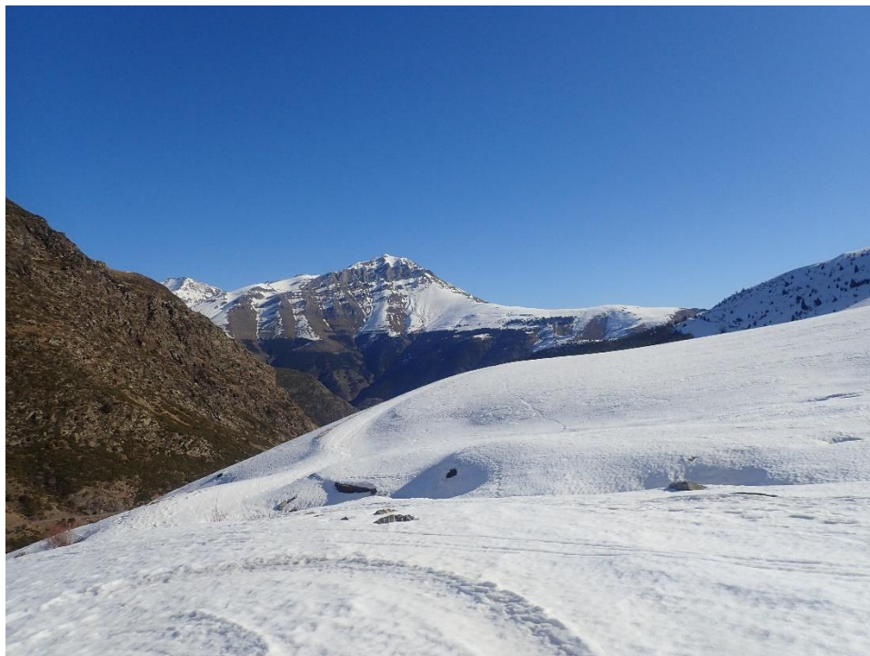
Imatge de la Vall de Filià (Ribagorçana-Vall Fosca), amb el Montsent de Pallars al fons, capturada el 18 de febrer de 2020. S'observa, als dos plans de la imatge, la forta dissimetria en la disponibilitat de neu entre les orientacions solanes i obagues.