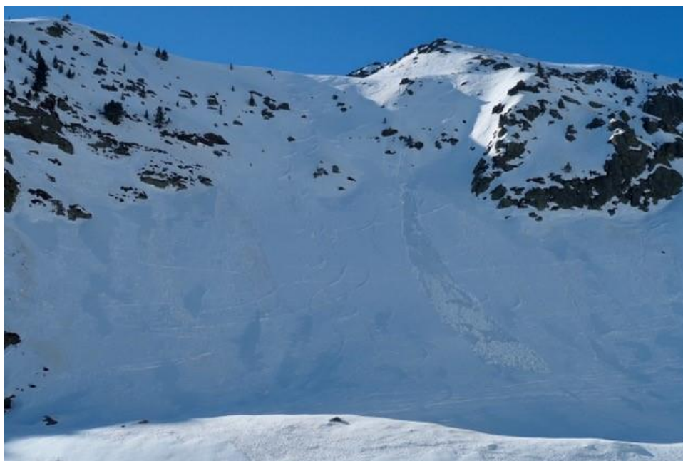
Allau de neu humida a Tavascan (Aran-Franja Nord de la Pallaresa). L'allau, de mida 1, es va desprendre entre els dies 14 i 21 de febrer, data de la imatge.