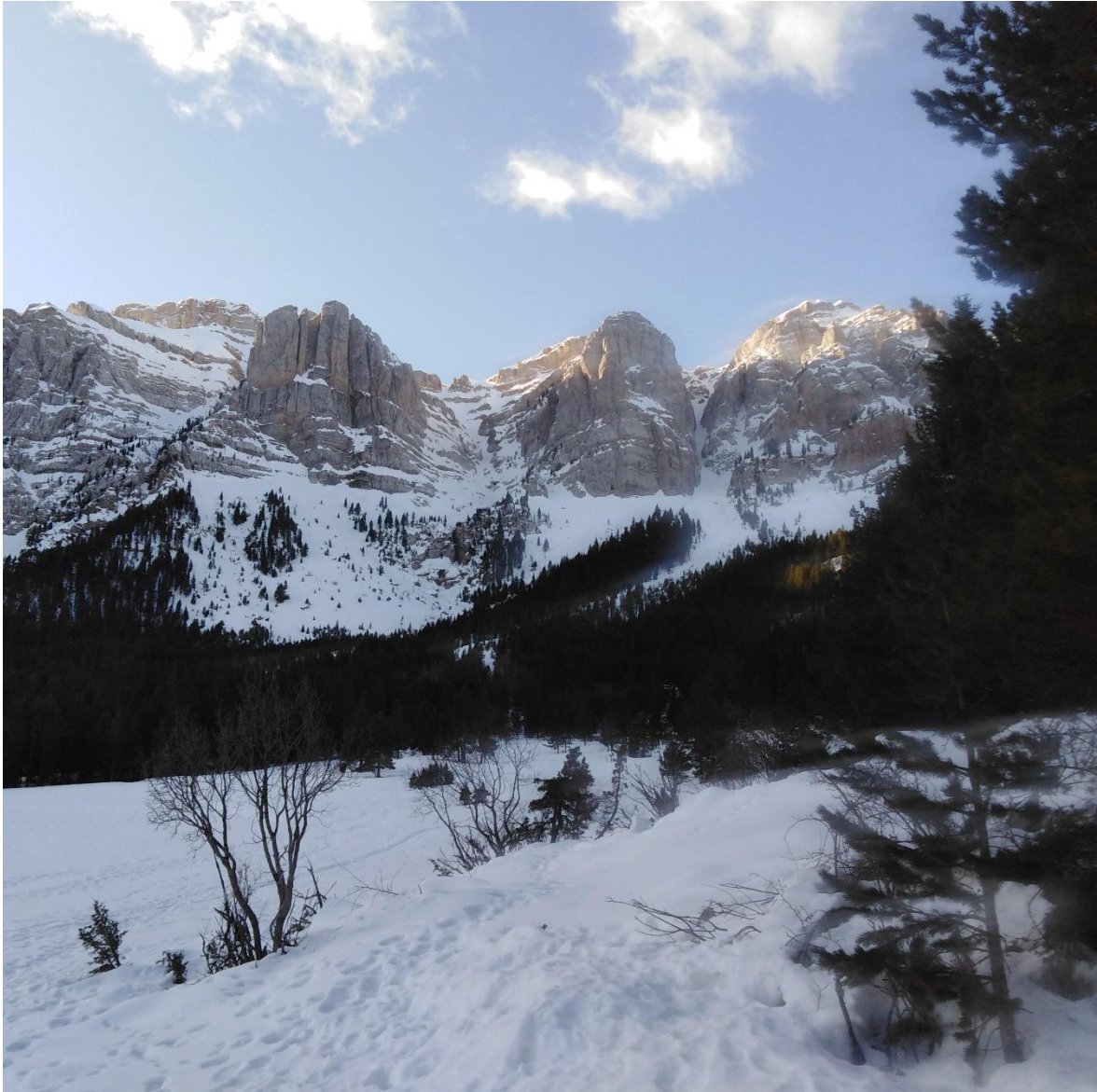
Panoràmica de la Roca i la Canal de l'Ordiguer i la Canal del Cristall (Vessant Nord del Cadí-Moixeró), del dimarts 4. Veiem un mantell uniforme, endurit i encrostat.