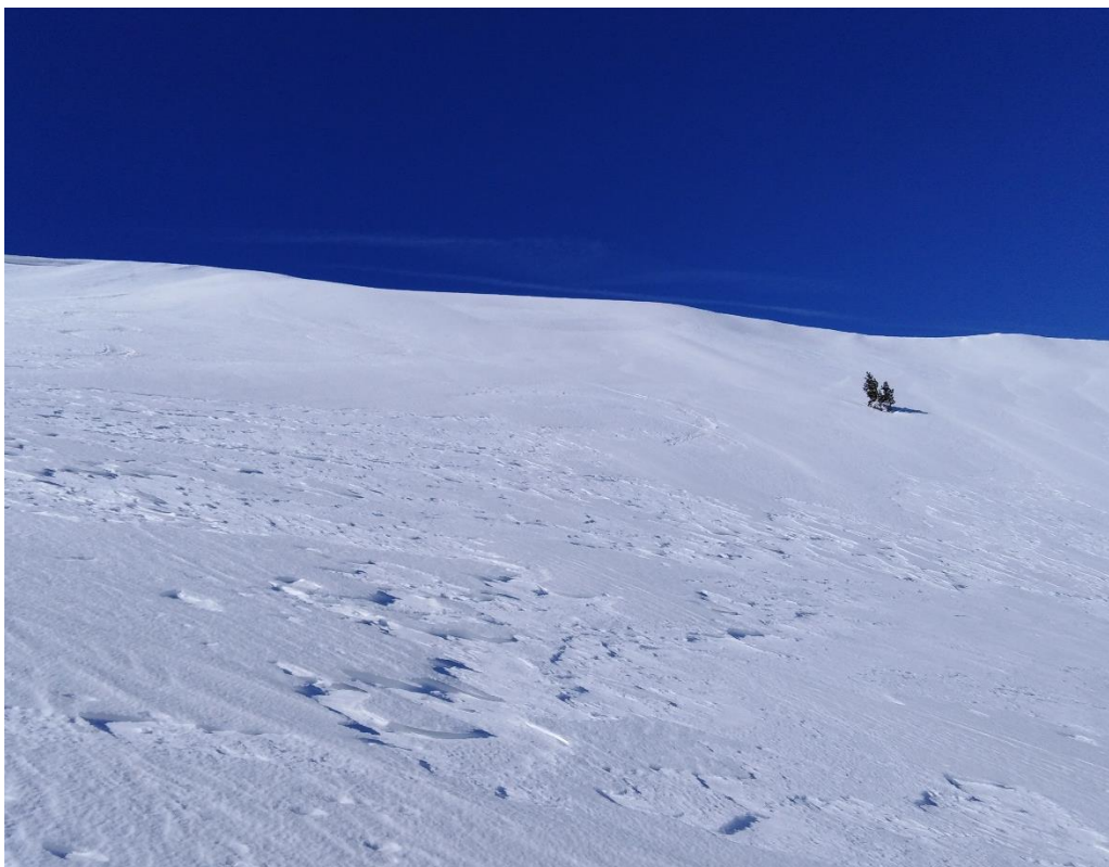
Neu endurida i encrostada, prèviament treballada per l'acció del vent, al Coll de la Barra (Perafita-Puigpedrós), del dia 5 de febrer.