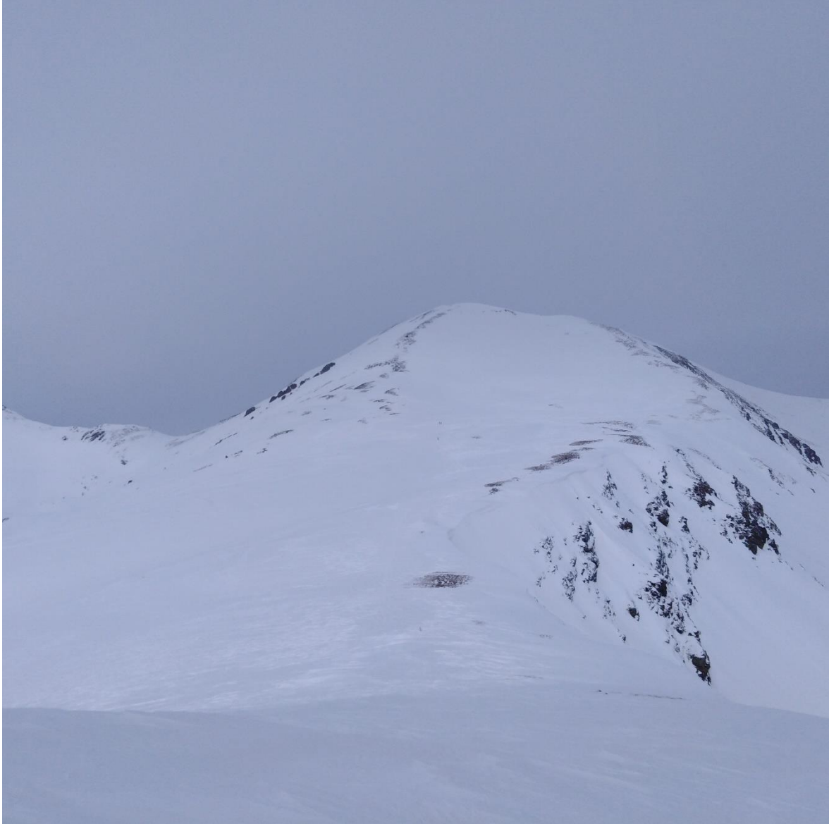
Cim del Bastiments, des del Coll de la Marrana (Ter-Freser), del dia 30 de gener, amb un mantell força homogeni a cota alta.