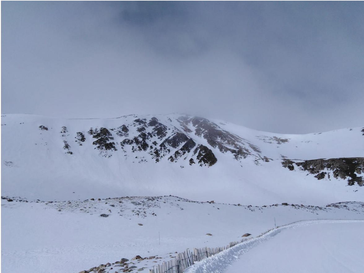
Panoràmica dels contraforts orientals del Bastiments des de Vallter (Ter-Freser), de dimecres 8 de gener. A cota alta encara es veu un mantell uniforme malgrat la presència de deflacions a carenes i cims.