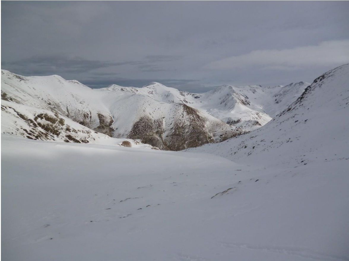
Imatge de paisatge del Ter-Freser del passat 13 de desembre. Veiem un mantell uniforme i amb la neu recent de l'episodi del nord-oest. Es veuen algunes deflacions degut a les fortes ventades.