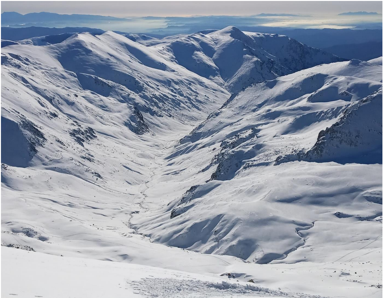
Imatge de la vall de Coma de Vaca des del cim del Bastiments (2881 m) del passat 7 de desembre. Veiem un mantell uniforme des de fons de vall al Ter-Freser.