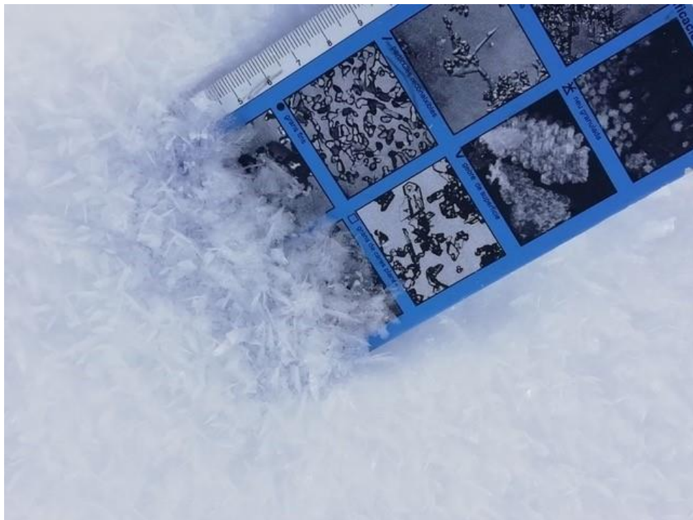
Interessant imatge de la presència de gebre de superfície al Vessant Nord del Cadí-Moixeró. Aquest gebre actuarà com a capa feble persistent en obagues arrecerades o allà on es mantingui, especialment a cotes altes, on es mantingui sec i on no regeli.