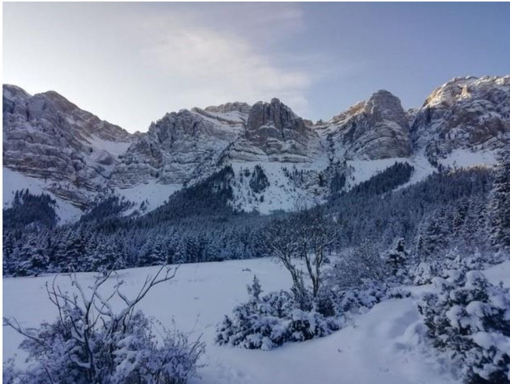
Imatge de la Roca de l'Ordiguer i la Canal del Cristall de dissabte 16 de novembre, amb la neu recent encara als arbres.