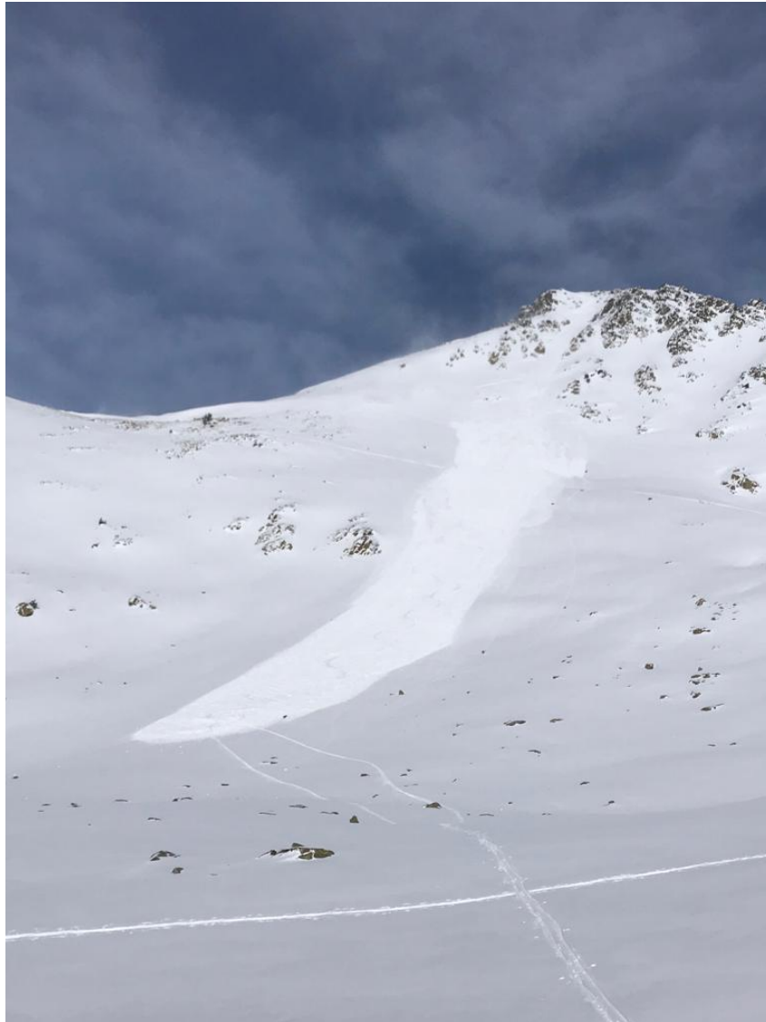
Imatge d'una allau de placa per neu ventada al vessant sud del Tuc de la Llança.