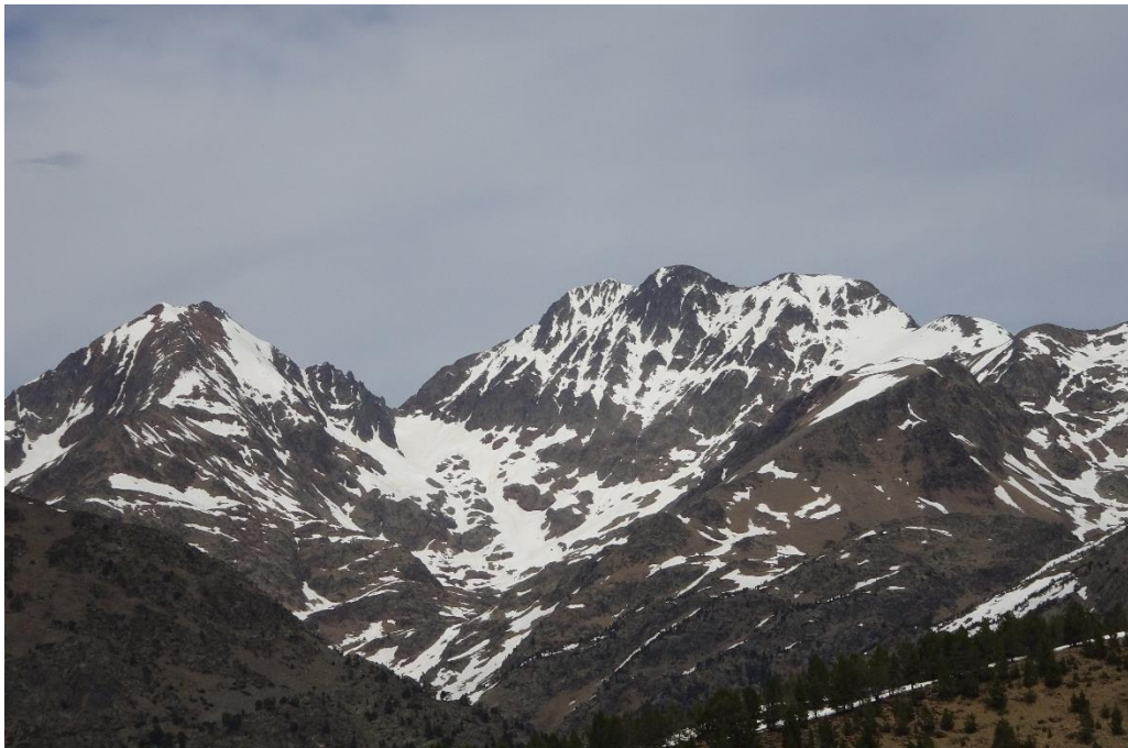
Imatge del massís de la Pica d'Estats del passat dijous, 16 de maig, on s'observa un mantell molt escàs a les solanes o, en tot cas, discontinu fins als cims. A les fondalades i les canals encara trobem un mantell esquiable per damunt de 2400 m.