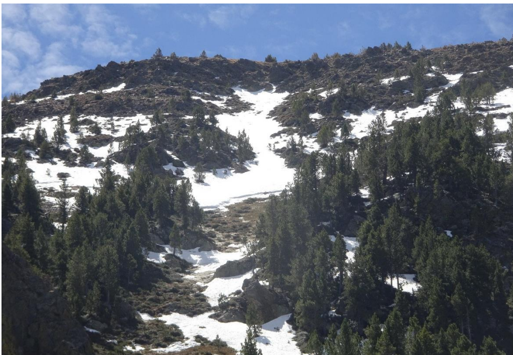
Imatge d'una obaga al bosc d'Aixeus (Pallaresa) del passat dijous, 16 de maig, on s'observa la cicatriu d'una allau de placa humida caiguda durant les darreres setmanes, desencadenada per la presència de capes febles persistents a la base del mantell.