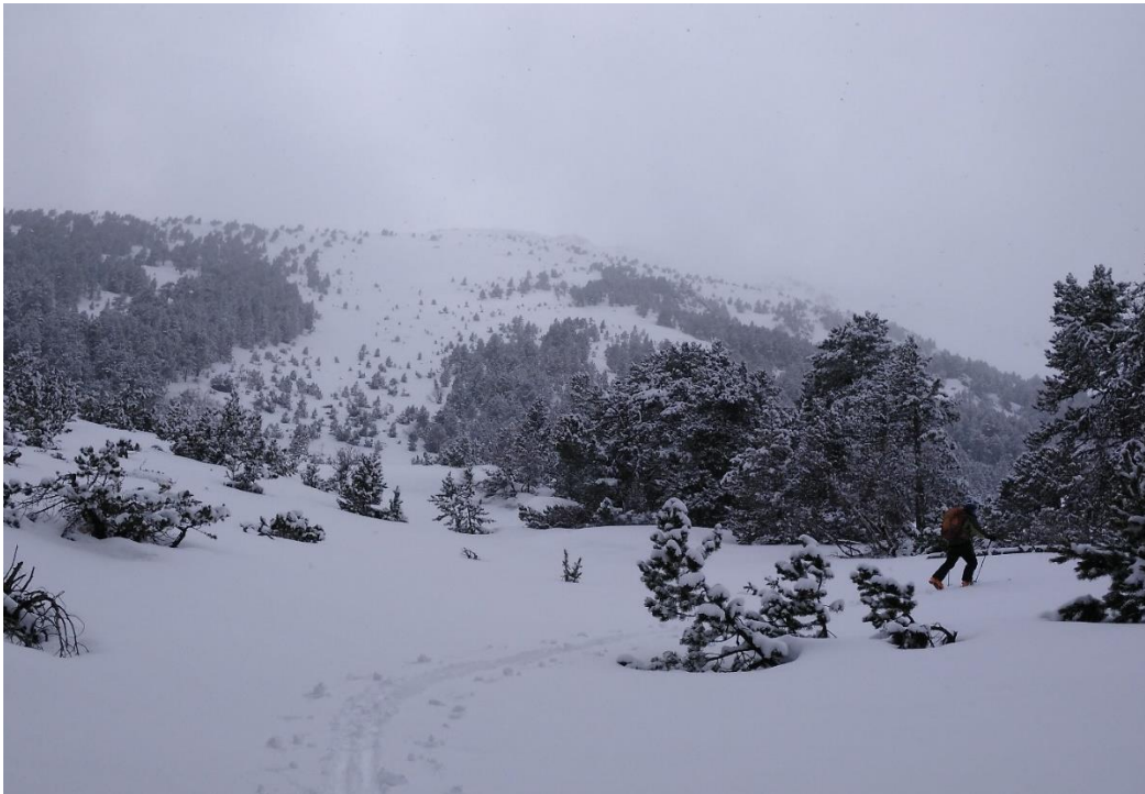
Imatge del Tèsol de Son (Pallaresa) del 3 d'abril de 2019. S'observa un paisatge innivat, amb gruixos de neu recent de 10 a 15 cm, acumulats fins el passat dimarts dia 2.