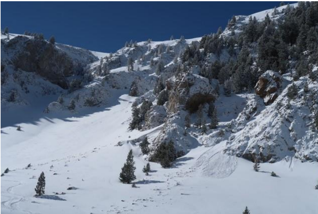
Imatge de Coma Oriola (Vessant Nord del Cadí-Moixeró) del 4 d'abril de 2019. Les nevades dels últims dies han deixat un mantell nival molt homogeni a la zona. Una petita purga de neu recent ha tingut lloc entre dimecres i dijous, probablement per l'efecte del sol sobre les roques.