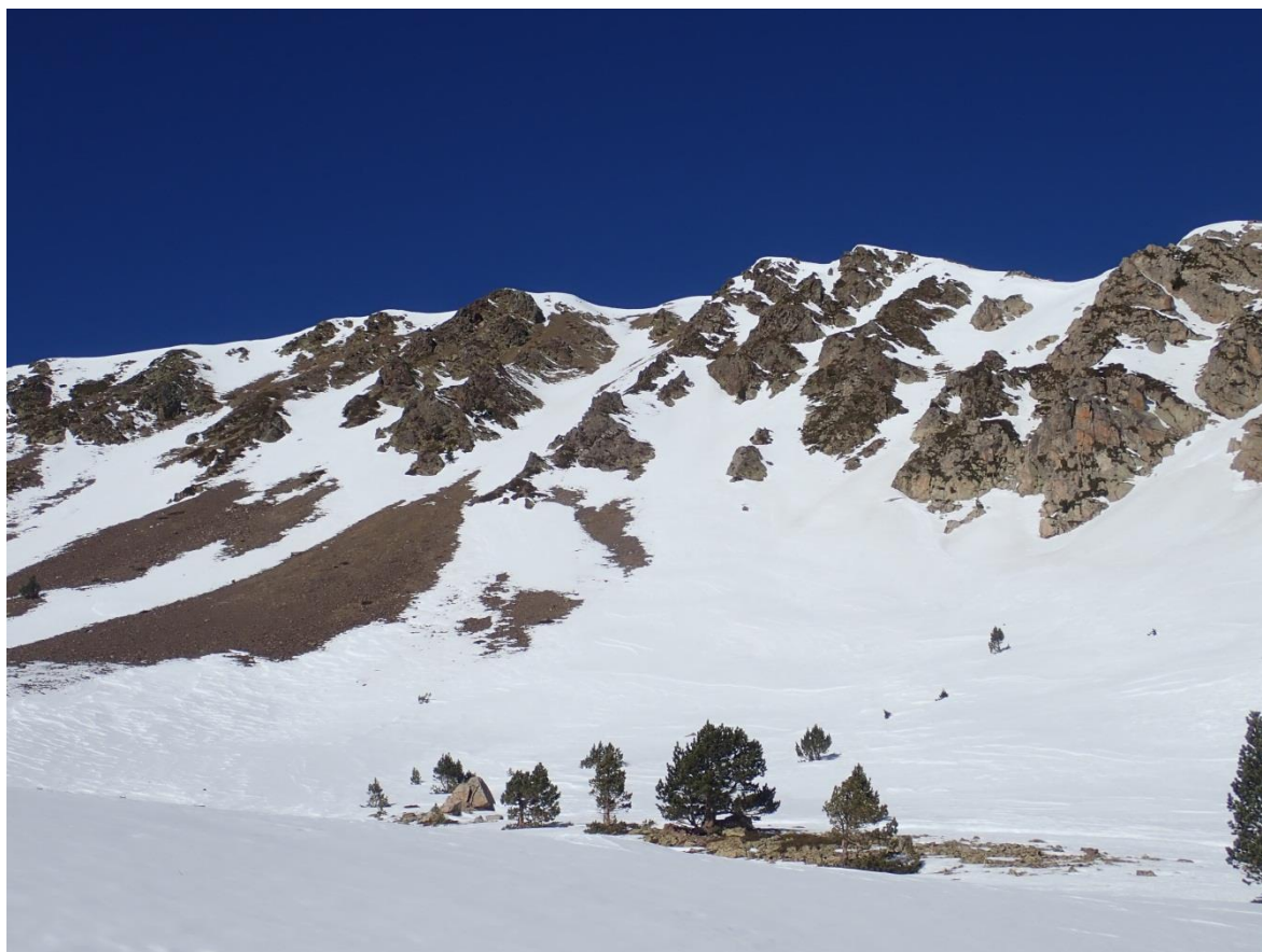
Imatge del Coll de la Barra (Perafita-Puigpedrós) del passat 22 de febrer on s'observa un mantell en regressió i discontinu degut als efectes del vent de setmanes enrere i la forta insolació d'aquests dies.