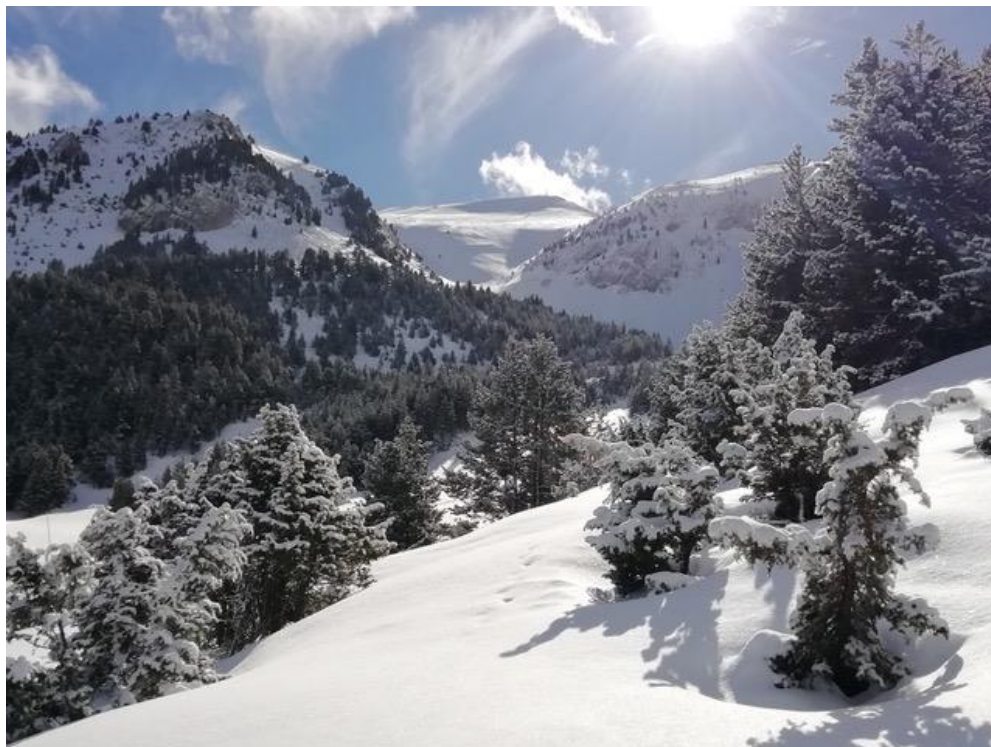
Imatge de Masella (bosc de les Pedrusques) de l'1 de febrer on s'observa un mantell continu a les obagues amb gruixos més normals per l'època.