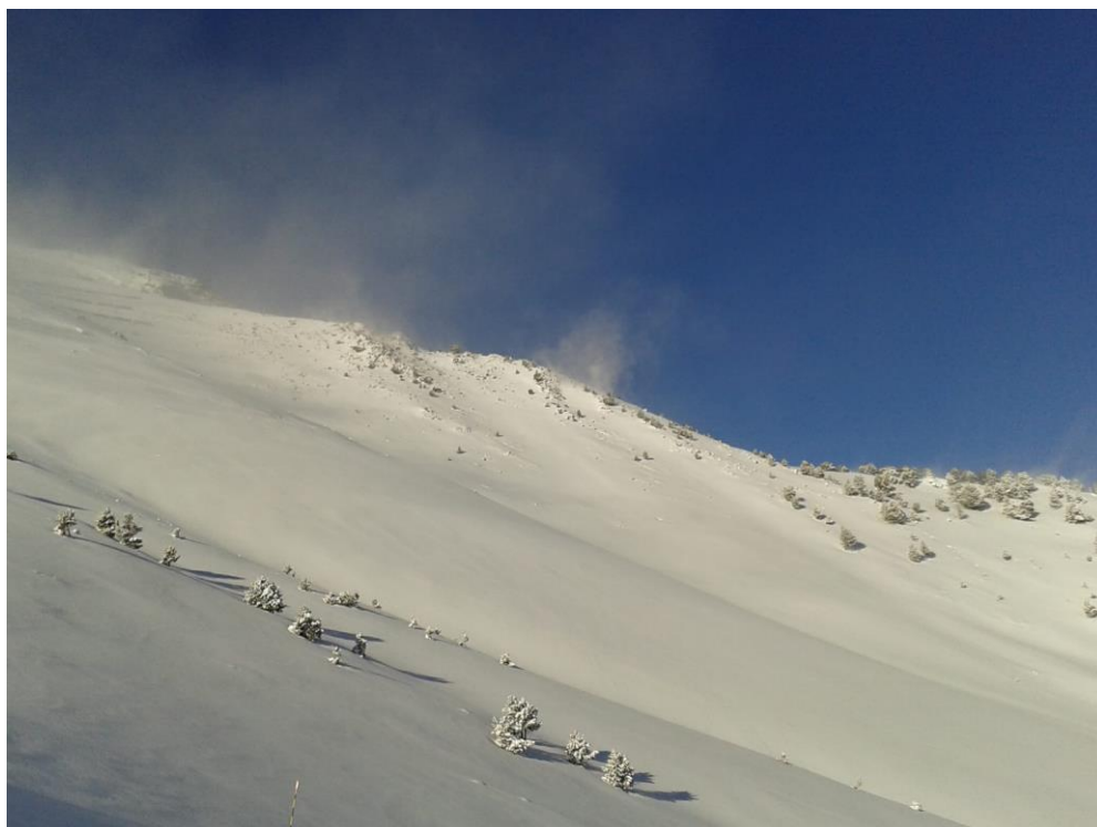
Imatge d'Espot (Pallaresa) del passat 1 de febrer on s'observa la neu recent i els efectes del vent moderat en l'episodi de sud en els colls i carenes més exposades que ha provocat la formació de plaques en orientació nord.