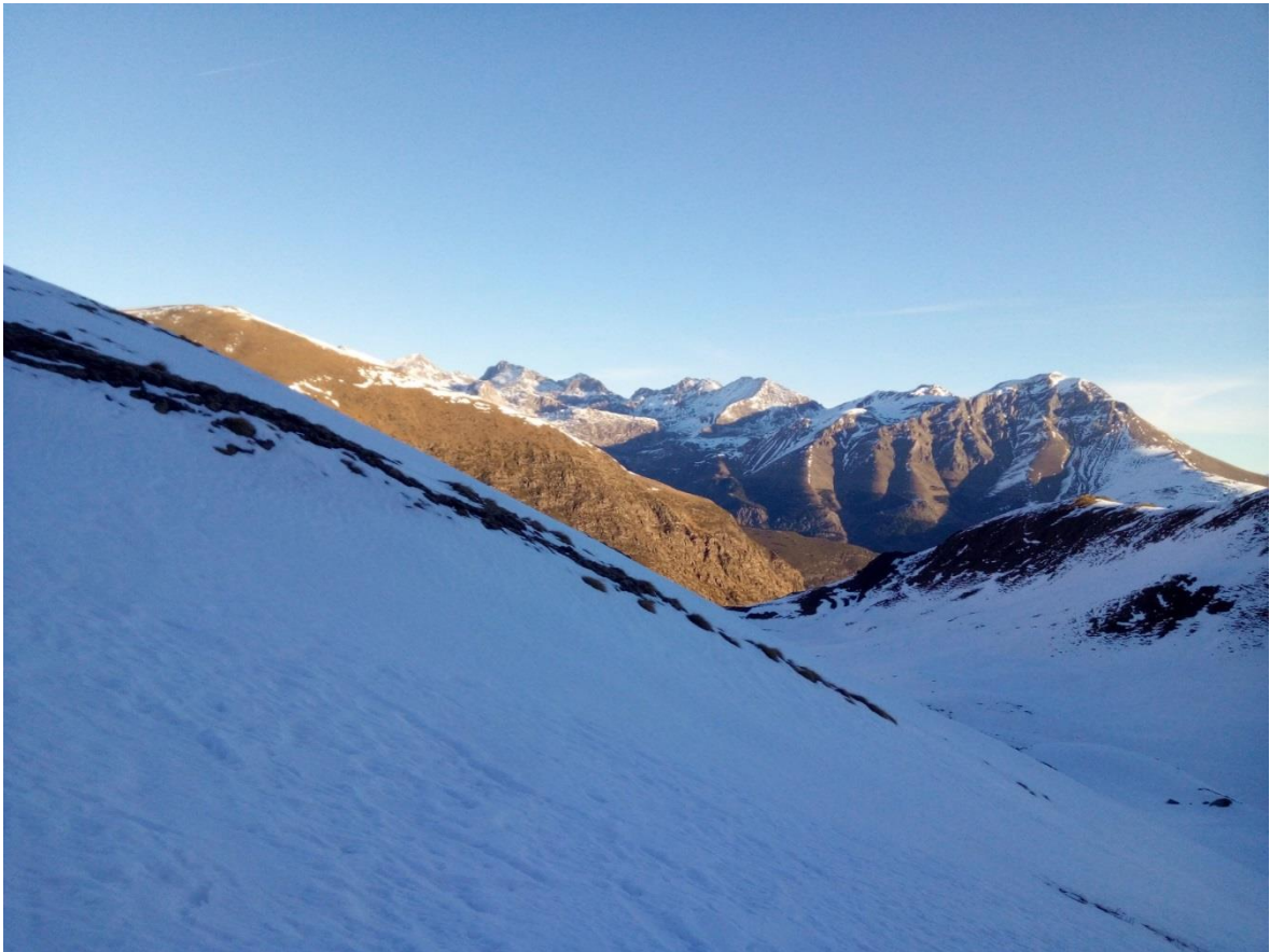
Imagen del Vall de Felià (Ribagorçana-Vall Fosca) del 27 de diciembre de 2018 donde podemos observar un manto irregular, más continuo en las umbrías e irregular o, incluso, inexistente en las solanas.