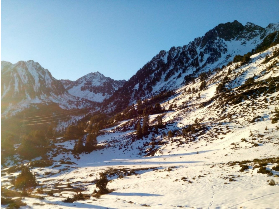
Imagen de la entrada hacia el Vall de Gerber (FNP) del pasado 28 de diciembre de 2018 donde se observa un manto irregular y discontinuo, con espesores muy escasos y muy por debajo de lo habitual para estas fechas.