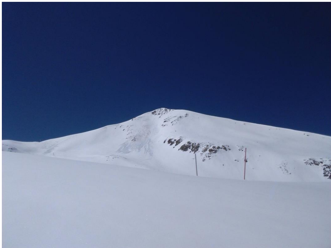
Imagen de Boí (Ribagorçana-Vall Fosca) del miércoles 2 de mayo de 2018. Los últimos episodios de nevada han tapado la nieve marrón de las semanas anteriores. La cobertura nival ha sido buena para el momento de la temporada en que nos encontramos. Se pueden observar aludes de nieve reciente que involucran poco espesor.

Evolució del espesor de nieve en Certascan (2.400 m, Franja Nord de la Pallaresa). Entre el lunes y el sábado se han registrado nevadas en este sector, pudiendo destacar las del jueves. En el periodo se han acumulado más de 120 mm en este observatorio.