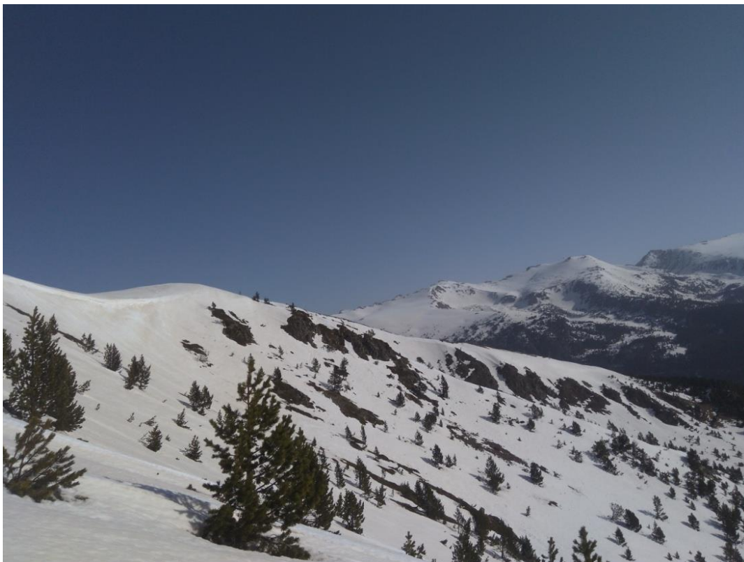
Imatge del Coll de la Barra (Perafita-Puigpedrós) de dimecres 25 d'abril. A les orientacions assolades la distribució del mantell comença a ser irregular a bona part de les cotes.