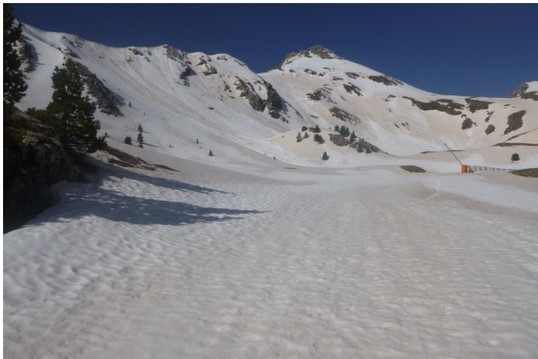
Imatge d'Espot, de divendres 27 d'abril de 2018. Les allaus de neu humida afecten a les orientacions obagues i deixen al descobert la capa de neu marró.