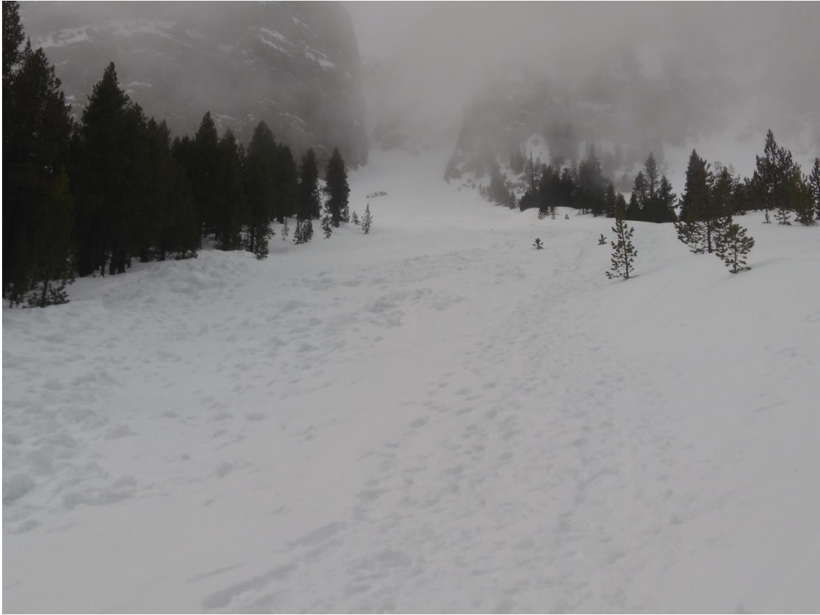
Imagen de la avalancha accidental de la Canal de l'Ordiguer (Vessant Nord del Cadí-Moixeró) del sábado 10 de marzo.