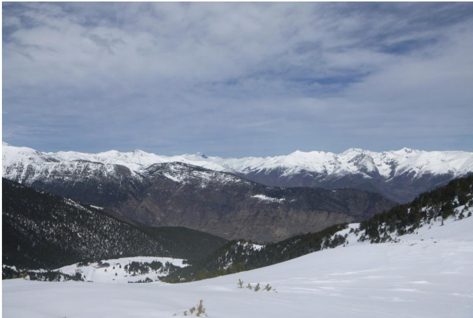
Imagen de paisaje desde Espot (Pallaresa) del viernes 9 de marzo. Buena parte de febrero ha sido caracterizada por nevadas hasta el fondo del valle. Las dos últimas semanas, con predominio de suroeste y paso de frentes han hecho que la cota de nieve haya subido hasta unos 1800 m en orientación sur y unos 1500 m en norte.