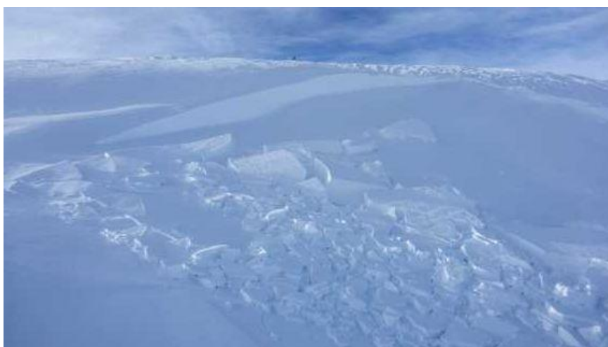
Imatge d'allau registrat al Pedró dels Quatre Batlles (Prepirineu) el dia 10 de febrer.