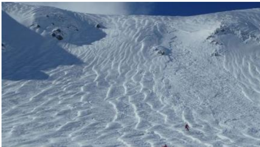
Imatge de l'allau que el dia 7 de febrer va arrossegar un esquiador al Coll de la Marrana (Ter-Freser).