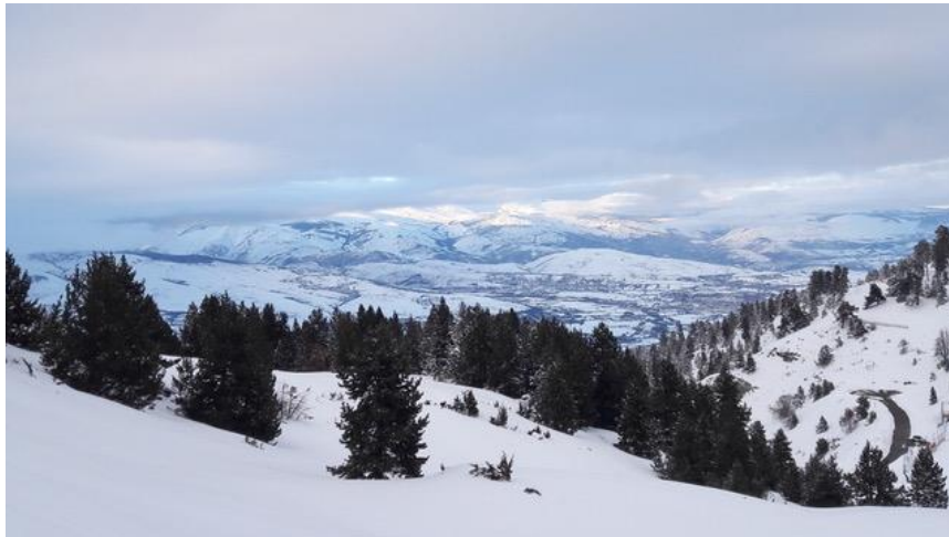
Imatge capturada el dia 6 de febrer des de Masella. Es pot observar el fons de la Cerdanya ben innivat; al fons, el Perafita-Puigpedrós ostenta els màxims gruixos de la temporada.