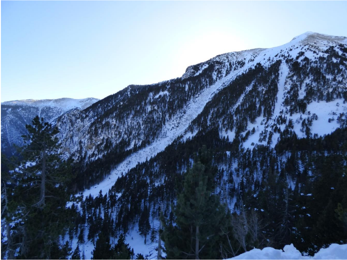
Imatge general de l'allau a la Canal del Príncep, al vessant oriental del Gra de Fajol Petit (Ter-Freser); el desnivell de l'allau supera els 400 m.