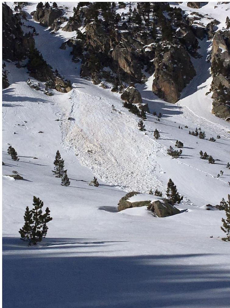
Imatge d'allau a Contraix (Ribagorçana-Vall Fosca). Tot i que la fotografia és del 18 de gener, la data de l'allau és probablement el 15 o 16 del citat mes. L'allau s'inicia a la zona de roques donat el major escalfament d'aquestes respecte a la neu.