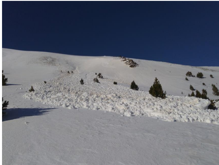
Imatge del 16 de gener: allau de neu humida al Coll de la Barra (Perafita-Puigpedrós).