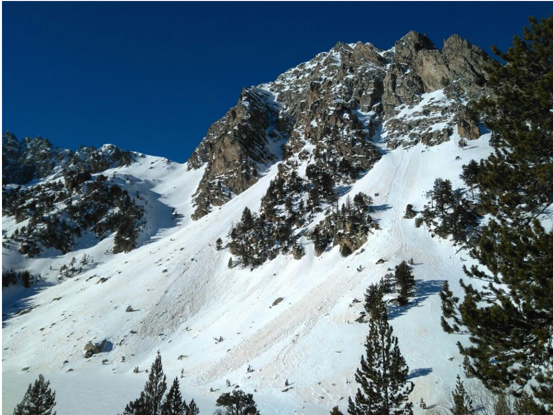
Imatge d'allau superficial de neu humida a Subenuix (Pallaresa) el 19 de gener, tot i que l'allau és probablement anterior.