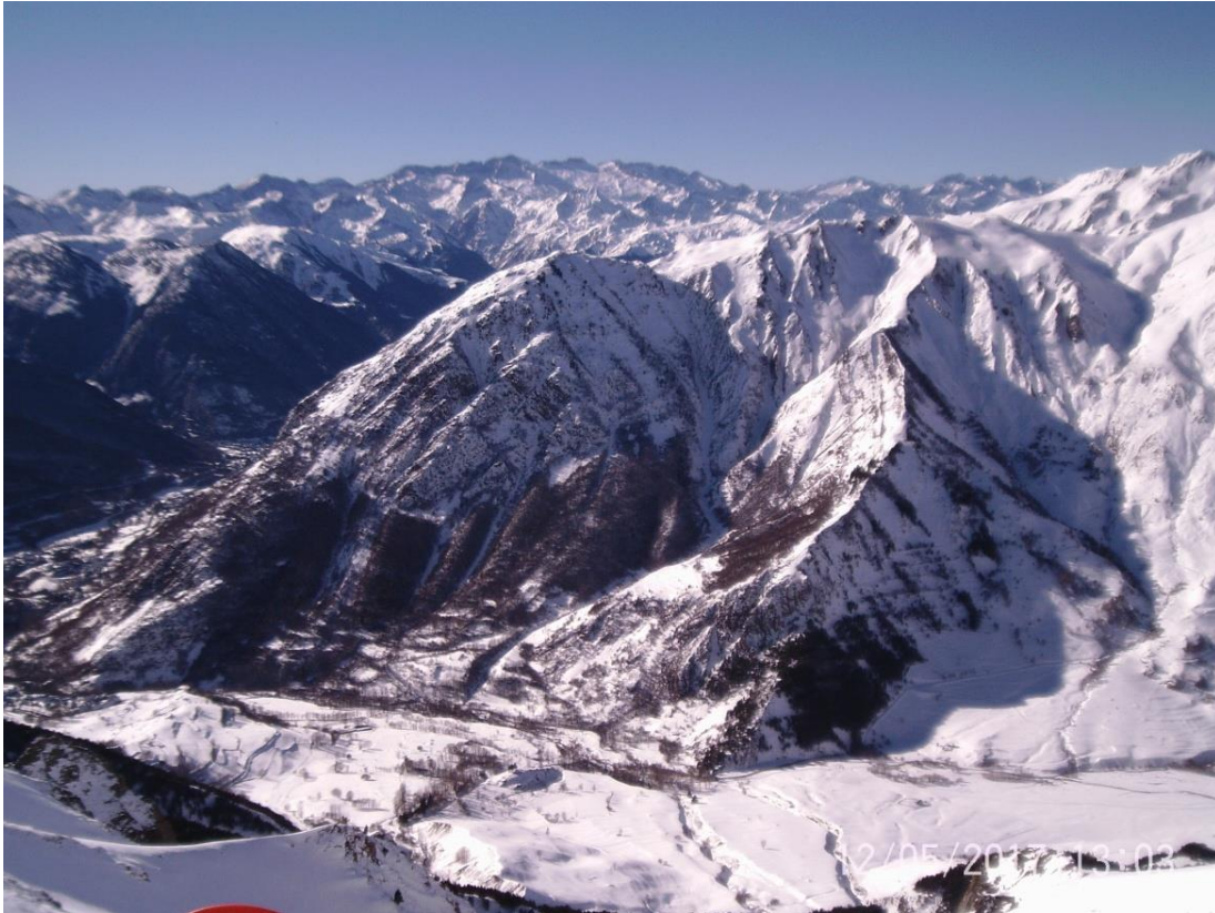
Imatge de paisatge registrada des del Tuc de Costarjàs orientada cap a l'oest datada el 5 de desembre. L'únic sector ben innivat ha continuat sent l'Aran-Franja Nord de la Pallaresa.