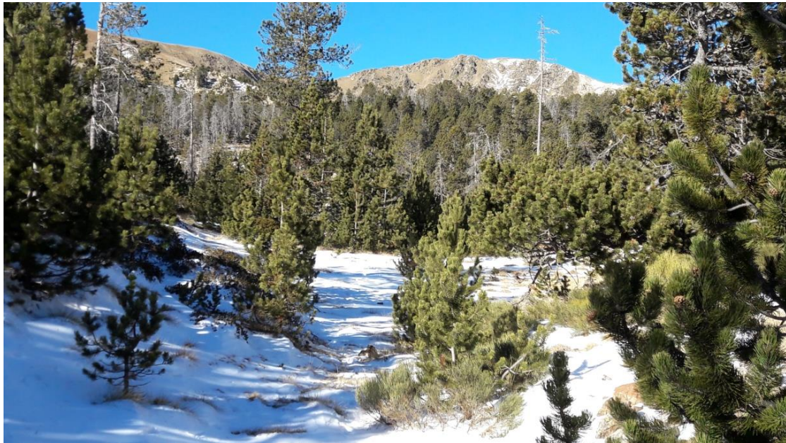
Imatge de zona boscosa a Arànsers (Perafita-Puigpedrós) del dia 6 de desembre. Es manté una prima i irregular capa de neu en sectors poc exposats a l'acció del vent; al fons, veiem els vessants més elevats sense neu. Aquesta imatge era representativa de la disponibilitat de neu a bona part del Pirineu.