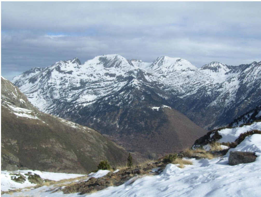
Imagen de paisaje tomada desde Tavascan (Aran-Franja Nord de la Pallaresa) el viernes 24 de noviembre. Aunque se trata del único sector con cierta innivación, el manto es todavía escaso y permite ver el suelo.

Temperaturas màxima y mínima horaria durante la semana del 20 al 26 de noviembre de 2017 en Bonaigua (Aran-Franja Nord de la Pallaresa), a 2266 m. La temperatura se ha mantenido positiva entre el lunes y el viernes. Por su parte, la temperatura de la nieve ha disminuido intensamente durante las madrugadas de lunes a jueves y se ha mantenido cercana a 0 °C durante el viernes.