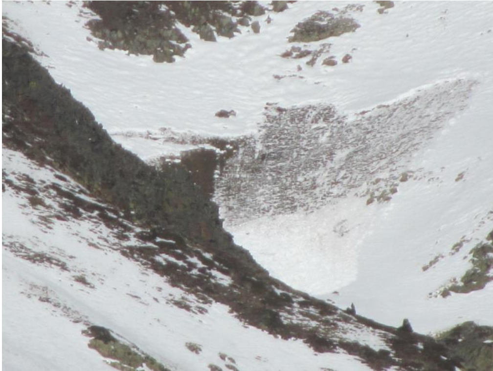
Imatge d'un lliscament basal registrada a Vallferrera, probablement caiguda divendres 24 de novembre.