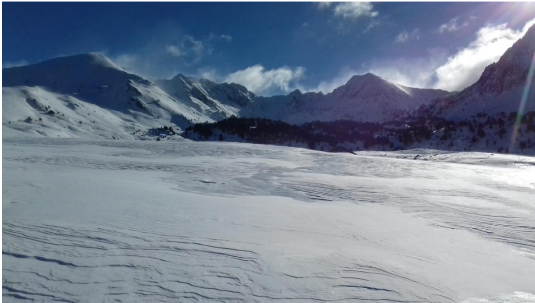
Imatge de Beret (Aran-Franja Nord de la Pallaresa) de dilluns 13 de novembre de 2017. Es pot intuir el transport degut a l'acció del vent de component nord.