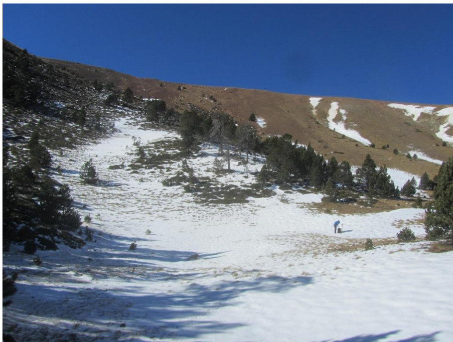
Imatge de Coll de la Barra (Perafita-Puigpedrós) del dia 14 de novembre de 2017. La neu al terra és escassa i de distribució poc regular.