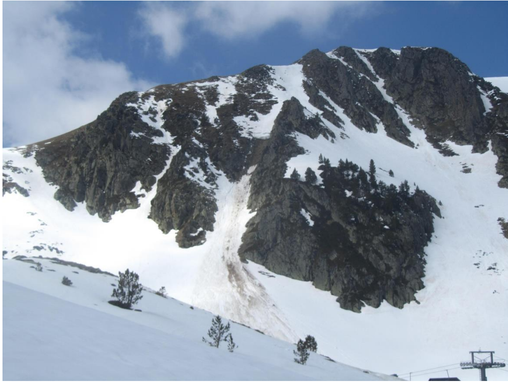
Alud de deslizamiento basal en una canal orientada al NE en la Franja Norte de la Pallaresa, de tamaño 2, fotografiada el jueves 4 de mayo.