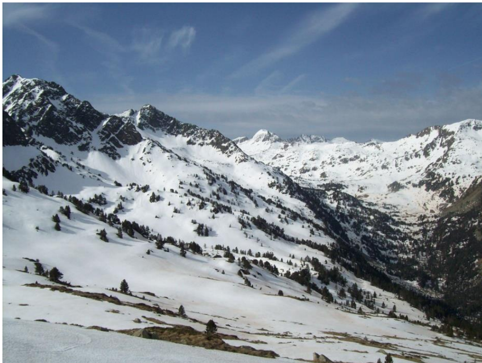
Vista del valle de Ruda en el Arán con el Tuc de Ratera al fondo, el viernes 5 de mayo. Cota de nieve en orientaciones norte por encima de 1900-2000 m.