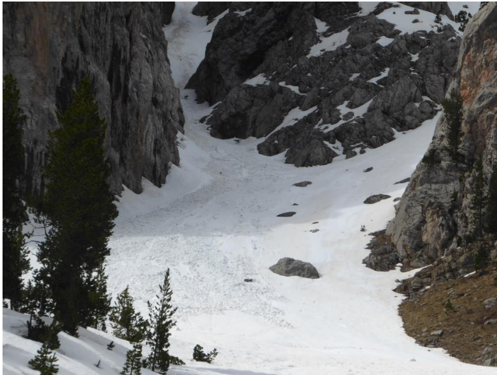
Alud de fusión en la Canal del Ordiguer, de tamaño 2, fotografiada el viernes 5 de mayo.