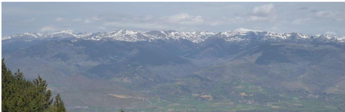
Fotografía del Perafita-Puigpedrós registrada el martes 25 de abril desde el Moixeró. La presencia de nieve en las vertientes soleadas empieza alrededor de 2400 m y presenta fuertes discontinuidades en todas las cotas.