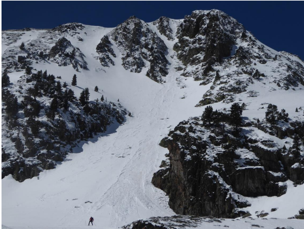
Imagen de un alud de tamaño 1 en Tavascan (Aran-Franja Nord de la Pallaresa) el viernes 28 de abril. Solo involucró la nieve del último episodio y aflora la nieve antigua beige.