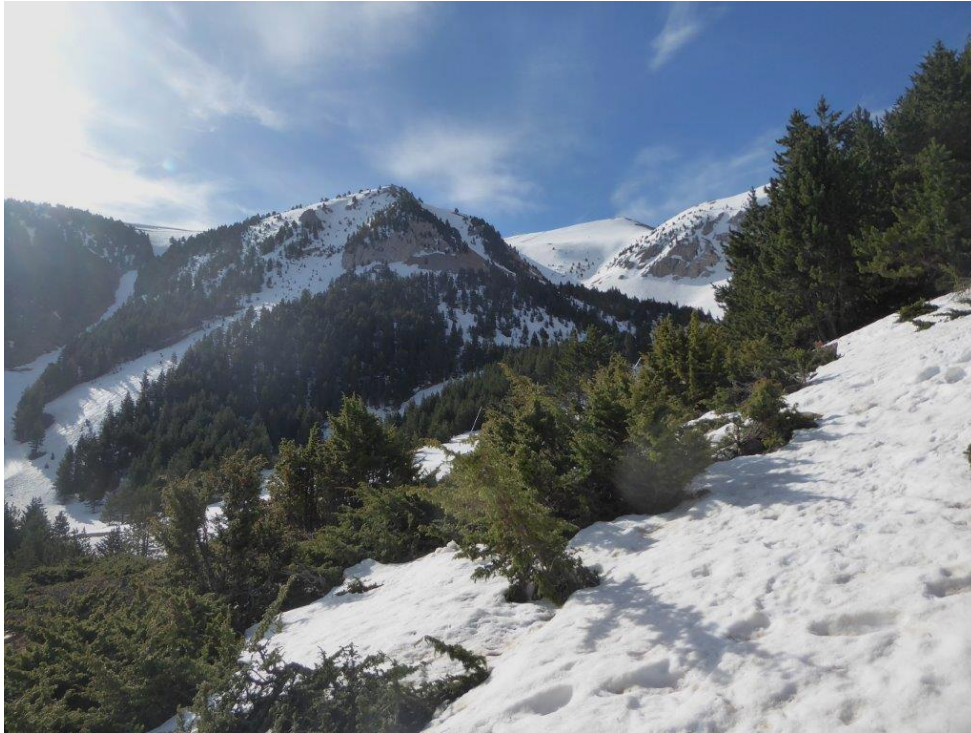
Al sector Cadí-Moixeró es manté un bon recobriment de neu en orientacions nord (foto del dimarts 18 d'abril). Aquesta temporada ha estat la millor en recobriment de neu al terra dels darreres 10 anys al Prepirineu i al Cadí-Moixeró.