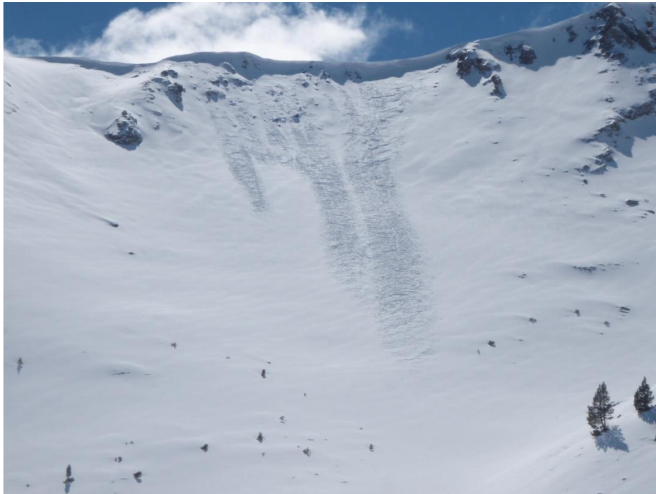
Imatge a Espot (Pallaresa) del dia 23 de març. Malgrat que l'episodi de nevades de mitjans de setmana va anar acompanyat de vent poc intens, es van formar cornises a indrets favorables, i fins i tot es van registrar algunes purgues.