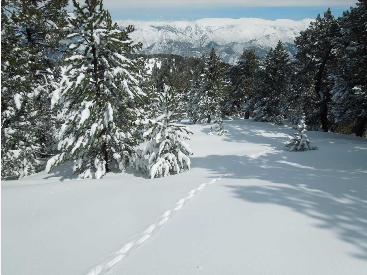
Imatge de Tuixen (Prepirineu) del dia 26 de març. Després de les quantioses nevades de divendres i dissabte fins a fons de vall, l'estat d'innivació al vessant sud del Cadí és alt. La neu es manté a les branques dels arbres; aquest és un indicati de que no ha perdut la seva cohesió inicial.