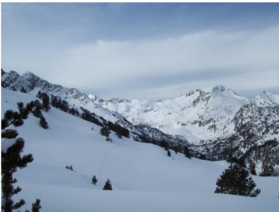
Imatge de Bonaigua (Aran-Franja Nord de la Pallaresa) del dia 24 de març. Aquesta temporada els gruixos de neu en aquest sector estan sent lleugerament deficitaris, degut a l'escassetat de les adveccions de nord i nord-oest. La nevada dels dies 22 i 23 de març va deixar entre 20-30 cm de neu recent en aquest sector.