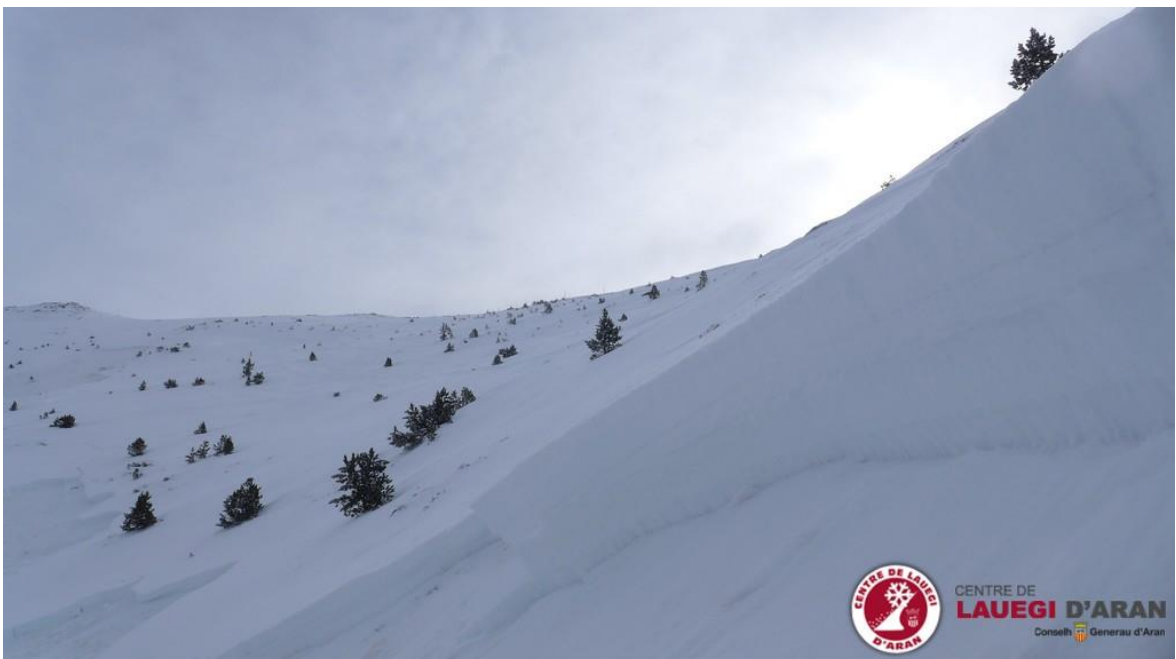
Fotografia de la cicatriu de l'allau accidental, divendres 10 de febrer, que va tenir lloc a Laveja (Aran) on un esquiador finlandès va quedar colgat, però va ser rescatat pel seu company en portar el DVA, pala i sonda, imprescindibles per a un auto-rescat.