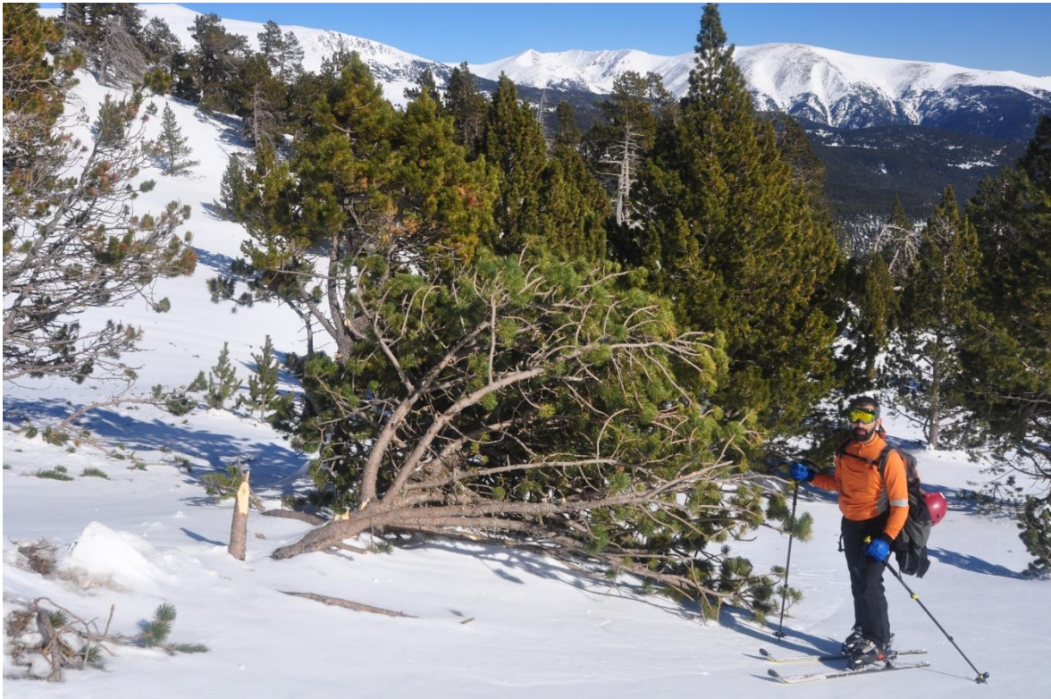
Restes d'una allau al sector del Perafita (Cerdanya) amb diversos arbres arrencats en una orientació NE, probablement durant la nevada de dilluns 6 de febrer.