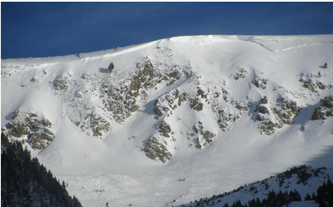
Fotografia de la Coma Ermada (Ter-Freser) del dia 19 de gener de 2017. La imatge mostra la cicatriu d'una allau que s'inicia a la cornisa.