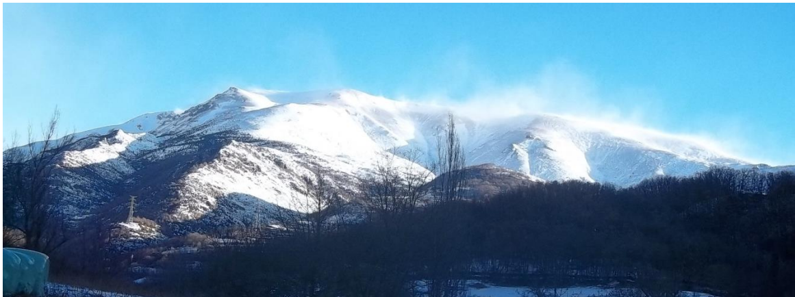
Imatge de paisatge a la Ribagorçana-Vall Fosca el dia 17 de gener de 2017. Un cop finalitzades les nevades, el transport de neu per vent va continuar sent intens.