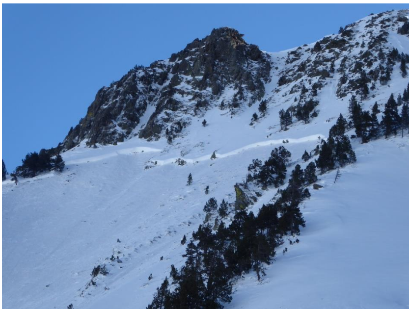
Imatge de Pales Sirgues, a Tavascan (Franja Nord Pallaresa) el 20 de gener de 2017. Hi apareix la cicatriu d'una allau provocada per explosius; la propagació de la fractura és molt clara.