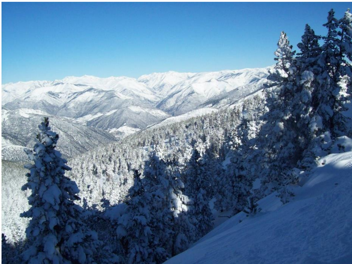
Imatge de paisatge del Pallars Sobirà des de Port Ainé del dia 18 de gener de 2017. La neu és present des de fons de vall.