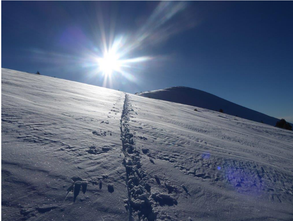
Al Pirineu oriental, al problema per capa feble persistent s'afegeix el de neu ventada per l'entrada de vent del nord-est el dimarts. A la imatge es veu bé la neu ventada, placa de vent tova, amb el dibuix característic per efecte del vent i la traça de certa profunditat (Prepirineu, dimecres 21 de desembre, foto: Gebreineu).