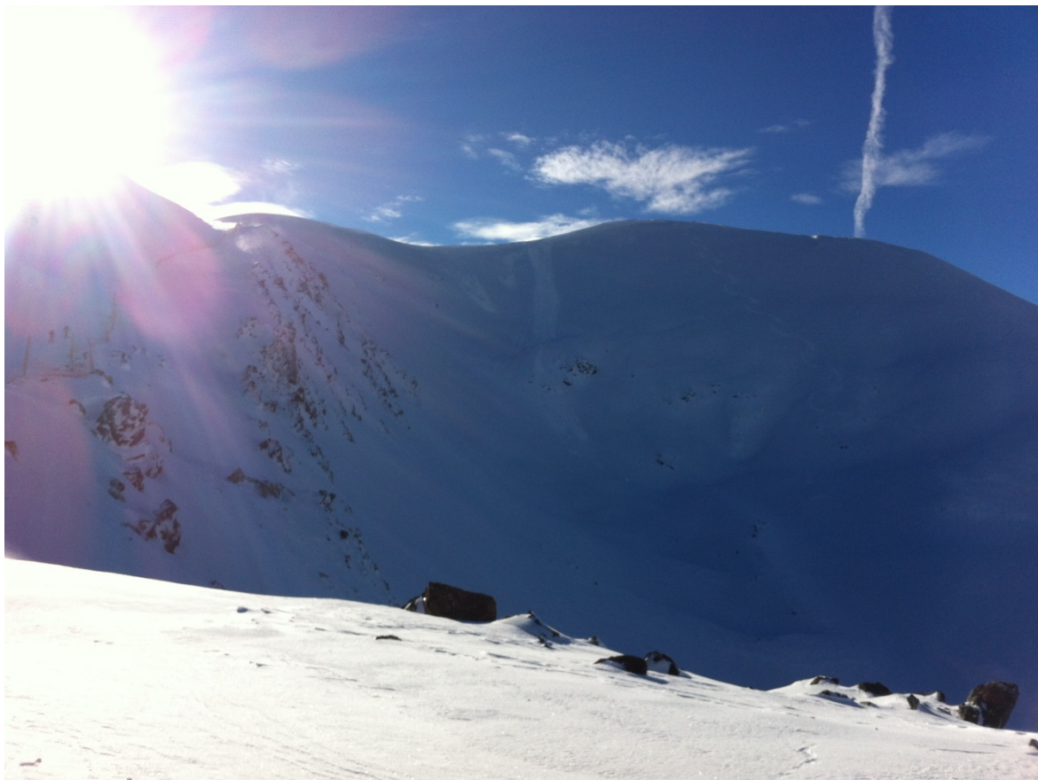
Allaus de mida 1 a la Ribagorçana en pendents força drets, a partir de la nevada de dissabte, (diumenge 27 de novembre de 2016).