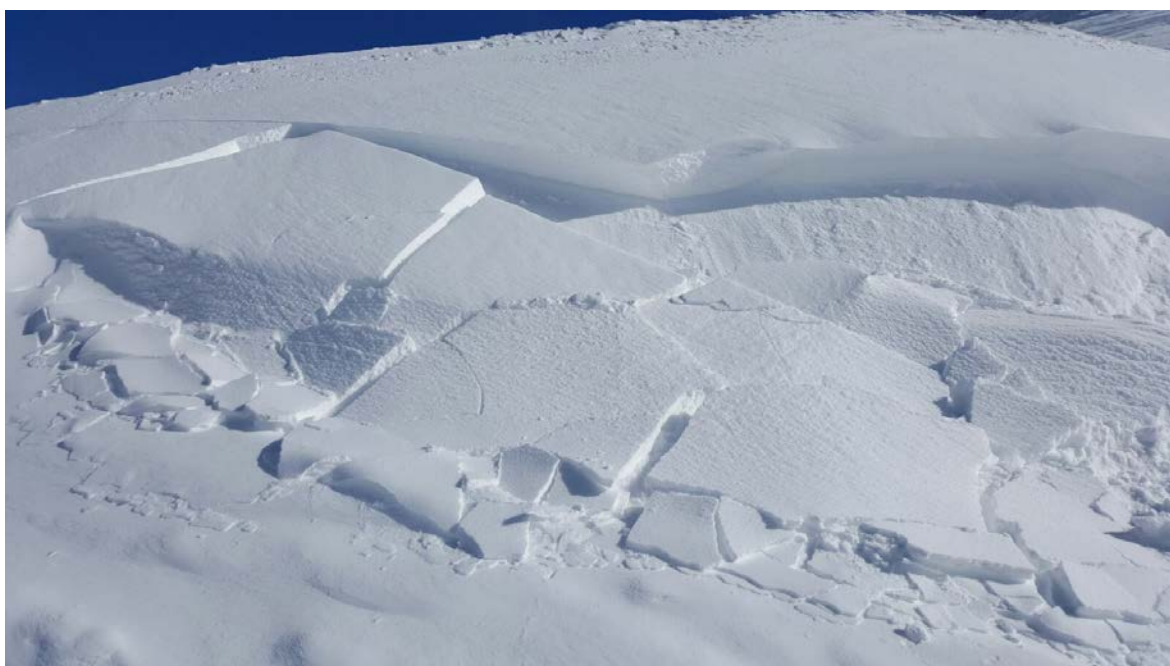
Placa fracturada de neu ventada de mida 1 a l'Aran, diumenge 27 de novembre de 2016.